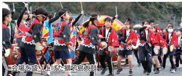
会場を盛り上げた獅子島太鼓