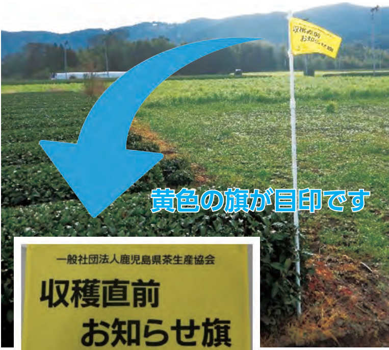
黄色の旗が目印です

○お知らせ旗が設置されたら 茶園に隣接する畑を防除する際には、風向きに留意するなど、農薬の飛散防止に協力ください。