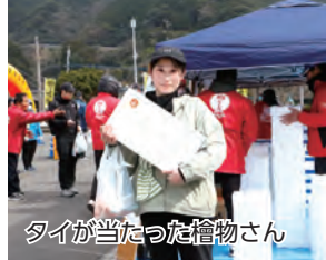
タイが当たった檜物さん