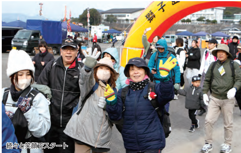
続々と笑顔でスタート