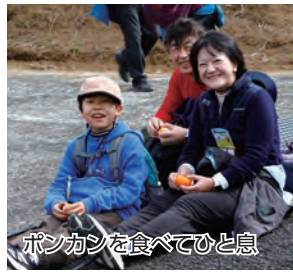
ポンカンを食べてひと息