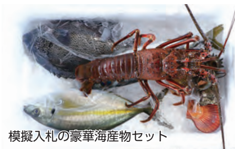
模擬入札の豪華海産物セット