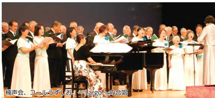
楠声会、コールうずしお、～Largo～の合唱