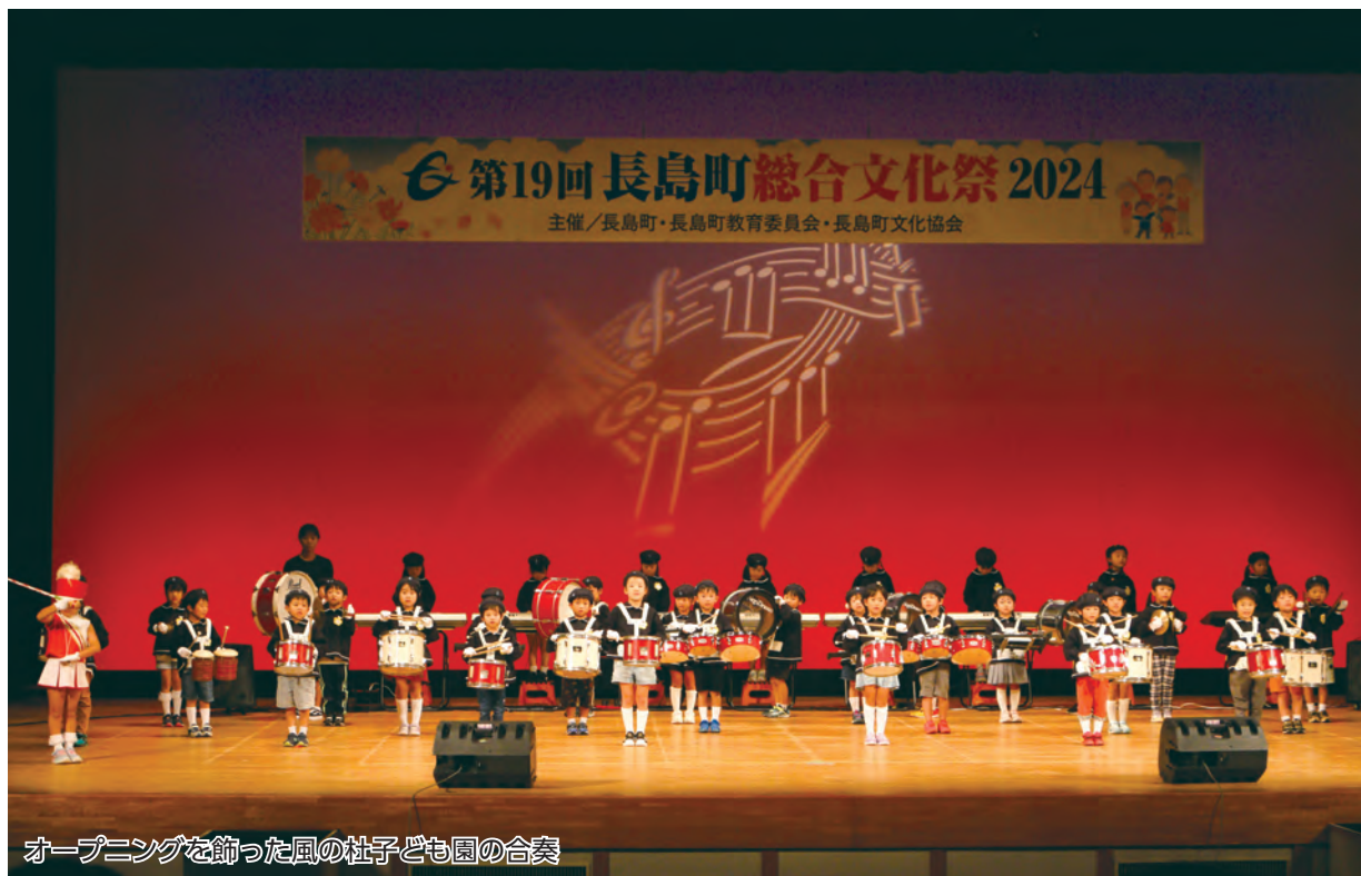
オープニングを飾った風の杜子ども園の合奏

第19回長島町総合文化祭が11月9日と10日の2日間、町文化ホールとB&G体育館で開催されました。