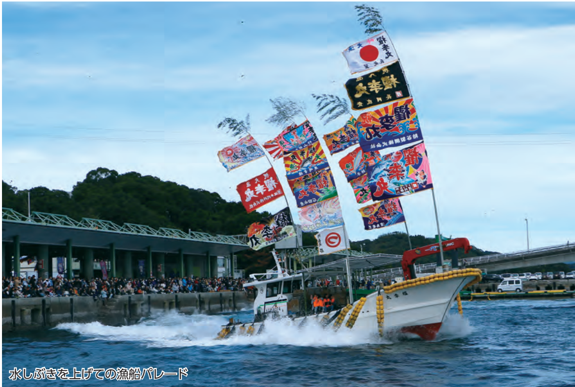
水しぶきを上げての漁船パレード

第17回長島おさかな祭りが11月24日、薄井漁港で開催され、約1万2千人の来場者でにぎわいました。