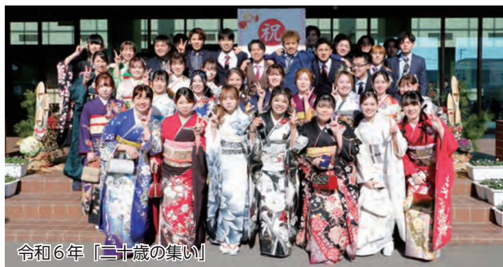
令和6年「二十歳の集い」