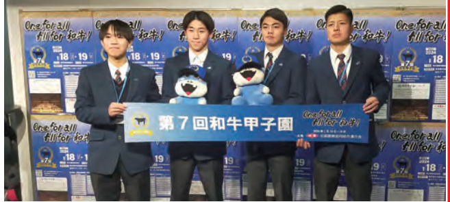
和牛甲子園に出場した本町出身の鶴翔高校生

の高校牛児と交流が出来き、有意義だった。枝肉の結果については、肉量と肉質で良い牛ができた」と大会を振り返りました。