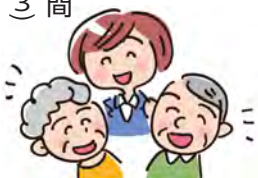
第16回(前回)交流会の様子