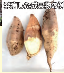
発病した成果物の例