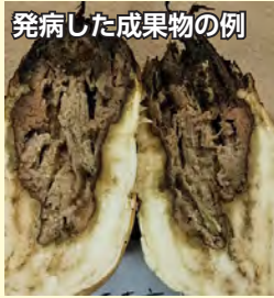
発病した成果物の例