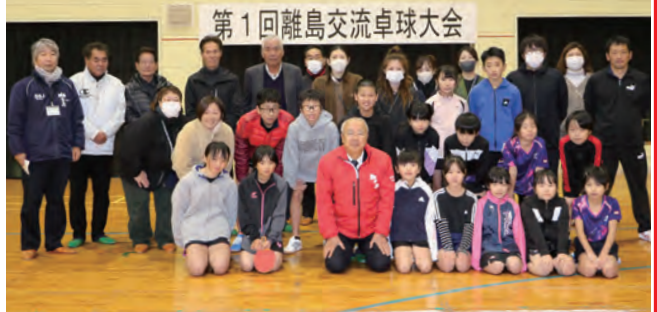
全力で競技を行う子どもたち