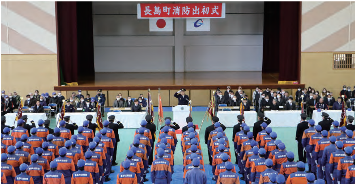
長島町消防出初式