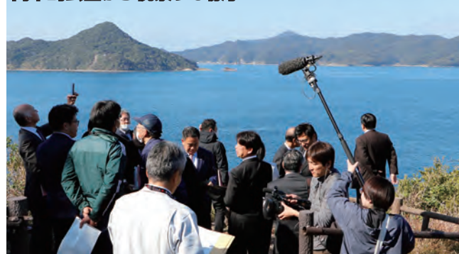
高串崎公園から視察する様子

きたい。今後も三県が協力して国に働き掛けて行く」と三県架橋への思いを話しました。