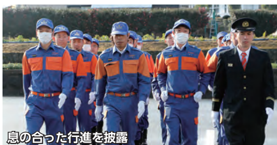
息の合った行進を披露