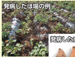
発病したほ場の例