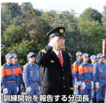
訓練開始を報告する分団長