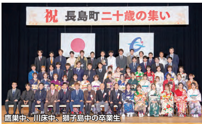
鷹巢中、川床中、獅子島中の卒業生

式典終了後のお祝い行事では、和太鼓の演奏や各中学校の思い出のアルバムが上映され希望にあふれた二十歳の門出を祝いました。