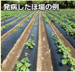
発病したほ場の例