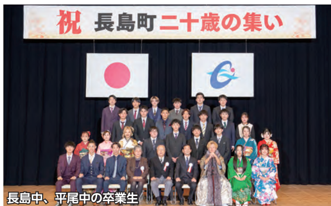
長島中、平尾中の卒業生