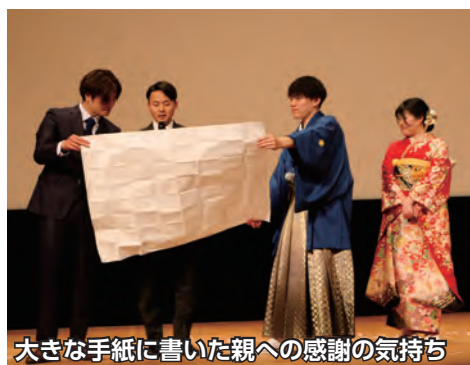
大きな手紙に書いた親への感謝の気持ち