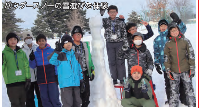
パウダースノーの雪遊びを体験

イ先の家の玄関が2階にあることやレンガ造りの暖炉など鹿児島には無い家の作りに驚いた。たくさんの交流ができてよい思い出になった」と振り返りました。