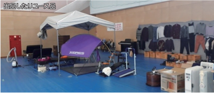
出品したリユース品

12月3日のながしまフェスタで「お宝市」として、集まったリユース品の無料配布を行いました。約330人の来場者があり、571点のリユース品を新しい使用者へつなぎゴミを減らすことができました。