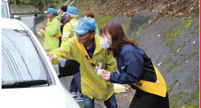
三色餅を手渡し交通安全の呼び掛け

夕暮れ前の午後4時過ぎには、ドライバーへ声掛けをしながら、交通安全への機運を高めるため、同協会員と阿久根警察署管内の職員など約15人がだんだん市場前の