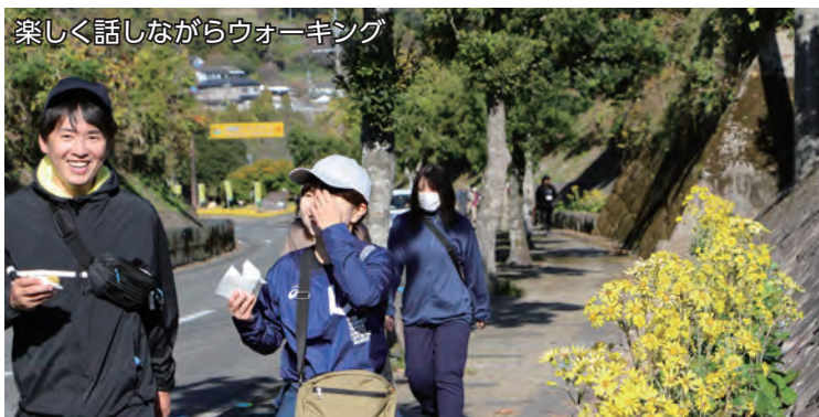
楽しく話しながらウォーキング