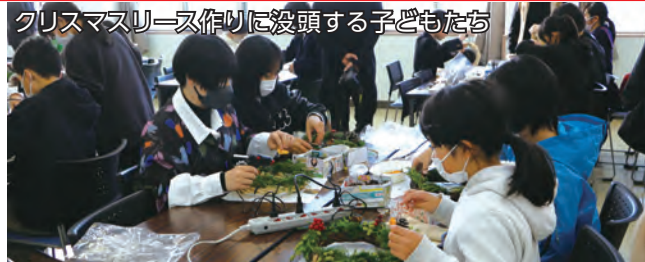
クリスマスリース作りに没頭する子どもたち

この日は、子ども会の表彰式や活動発表の後、子どもたちは創作活動大会（クリスマスリース作りとポッチャ