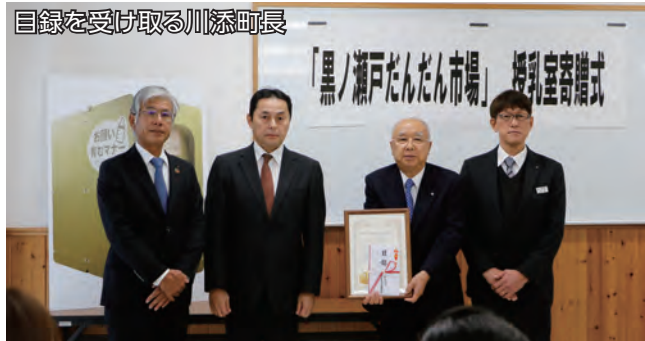
目録を受け取る川添町長

190センチ、高さ250センチで、中には大人1人がゆっくりと座れる椅子が設置され、災害時に対応できるよう、重さ約20キロで移動可能となっています。