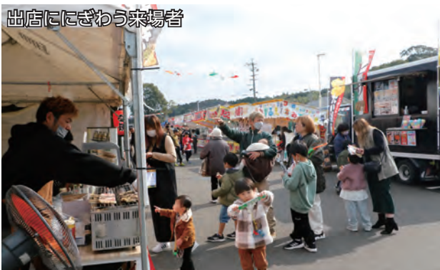
出店ににぎわう来場者