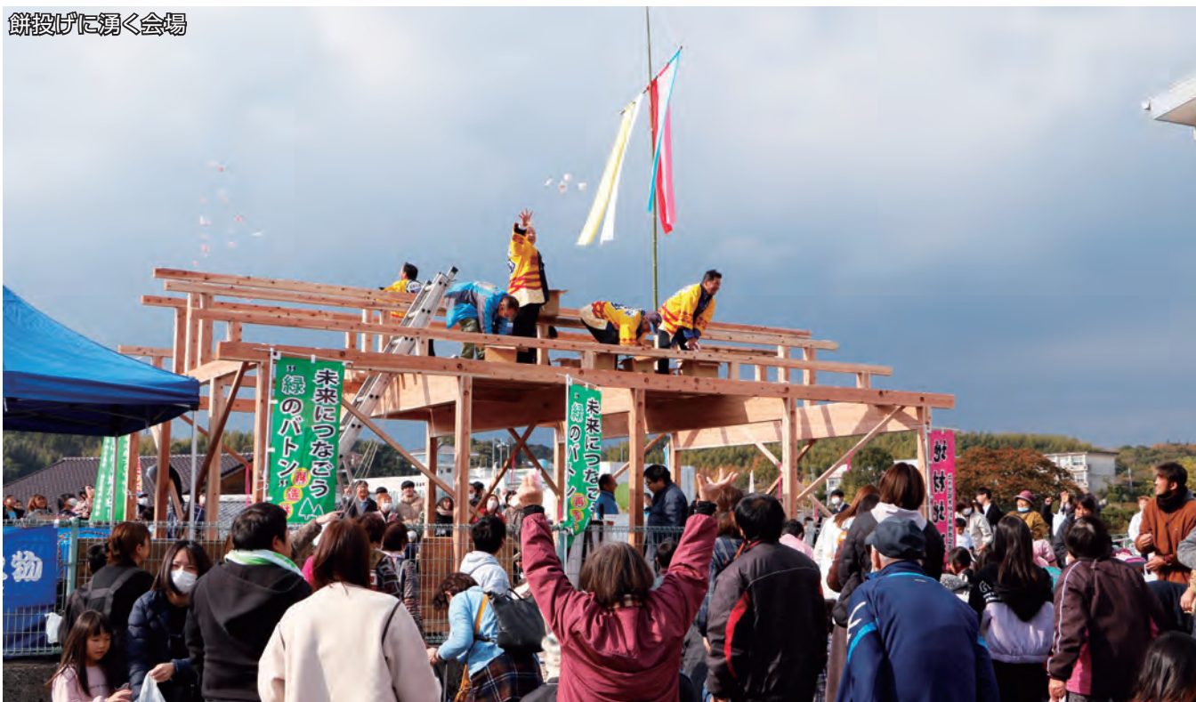
餅投げに湧く会場

（山中）は「おもちゃ大好き」と満足した表情でした。最後は恒例の餅投げが行われ、来場者は笑顔で餅を拾いました。