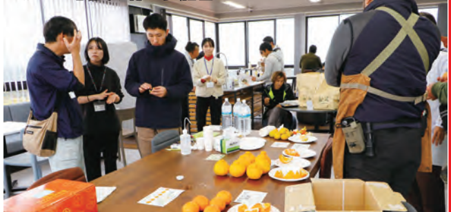
ミカンの試食を行う参加者ら

研修では、柑橘類の消費者の傾向や年末の需要、品種ごとの特徴などの講義後、試食会を行い、新種の「KC-5」や「紅まどんな」など4種類の日本各地の柑