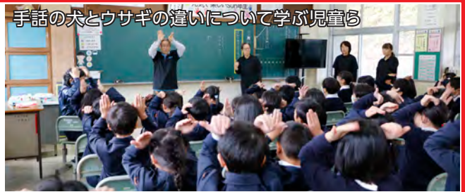
手話の犬とウサギの違いについて学ぶ児童ら