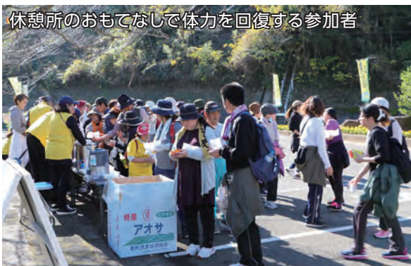
休憩所のおもてなしで体力を回復する参加者