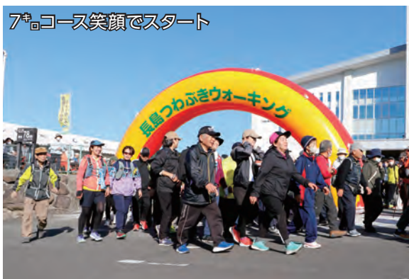
7 キロ コース笑顔でスタート