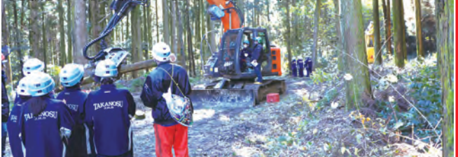
高機能性林業機械で作業を行う生徒ら

2限目から川床地区にある森に入り、実際に高機能性林業機械での作業を見学し操作しました。