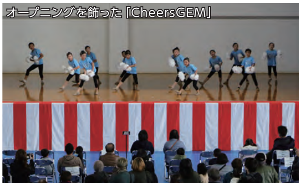
オープニングを飾った「CheersGEM」

令和5年度長島フエスタ（産業・福祉・健康まつり）が12月3日、町総合町民体育館周辺で開催されました。