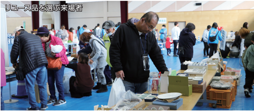
リユース品を選ぶ来場者