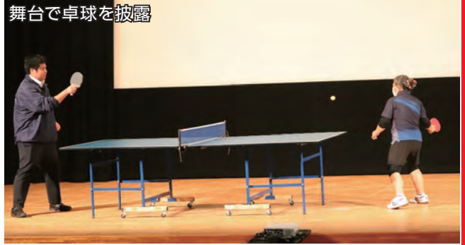
舞台上で卓球を披露

習に興味を持った。町の生涯学習の取り組みを友人に紹介したい」と生涯学習への意欲を話しました。