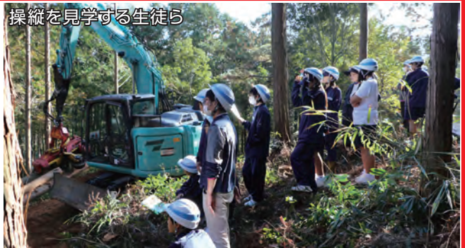
操縦を見学する生徒ら

生徒たちは、森林の重要性や重機の歴史、操作方法の講話の後、平尾地区の森林に入り実際に重機を操縦し、