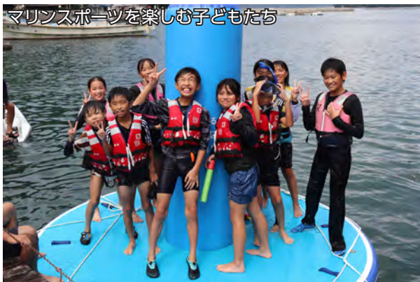
マリンスポーツを楽しむ子どもたち

子どもたちは「料理や遊びを通してみんなとふれあえてとても楽しかった」「みんなで協力する大切さを学びました」と学び舎を通して成長した様子でした。