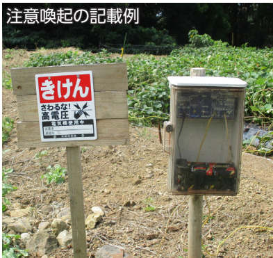
注意喚起の記載例