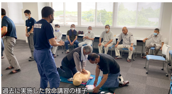
過去に実施した救命講習の様子

問い合わせ先 東分遣所 ☎(86) 0119 [直通] 長島分遣所 ☎(88) 5333 [直通]