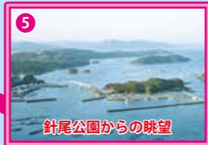
針尾公園からの眺望