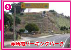
赤崎橋パーキングパーク