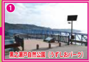
黒之瀬戸自然公園 (うずしおパーク)

(ご注意) ・この用紙は、機械で処理しますので、金額を記入する際は、枠内にはっきりと記入してください。また、本票を汚したり、折り曲げたりしないでください。 ・この用紙は、ゆうちょ銀行又は郵便局の払込機能付きATMでもご利用いただけます。 ・この払込書を、ゆうちょ銀行又は郵便局の渉外員にお預けになるときは、引換えに預り証を必ずお受け取りください。 ・この用紙による、払込料金は、ご依頼様が負担することとなります。 ・ご依頼様からご提出いただきました払込書に記載されたおとこところ、おなまえ等は、加入者様に通知されます。 ・この受領証は、払込みの証拠となるものですから大切に保管してください。