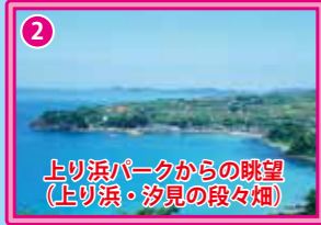
上り浜パークからの眺望 (上り浜・汐見の段々畑)