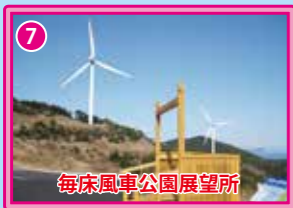
毎床風車公園展望所