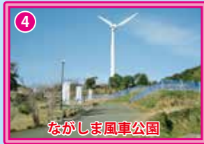
ながしま風車公園