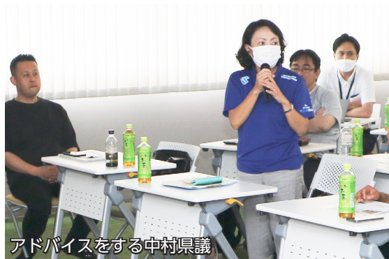
アドバイスを中村県議