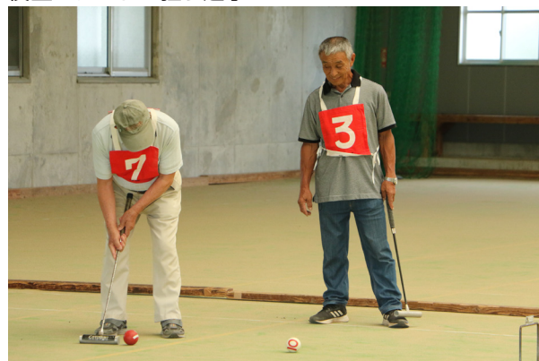
慎重にゲートを狙う選手