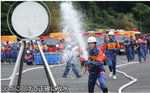
火点に向けて正確に放水