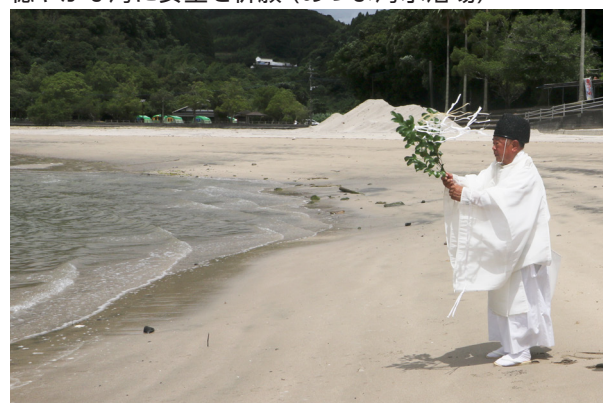
穏やかな海に安全を祈願(あづま海水浴場)

それぞれの神事には、町観光協会や周辺の公民館長、関係者などが出席し、海の無事故無災害を祈願しました。