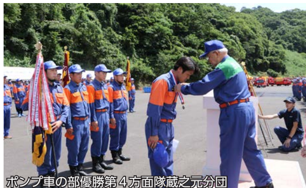
ポンプ車の部優勝第4方面隊蔵之元分団