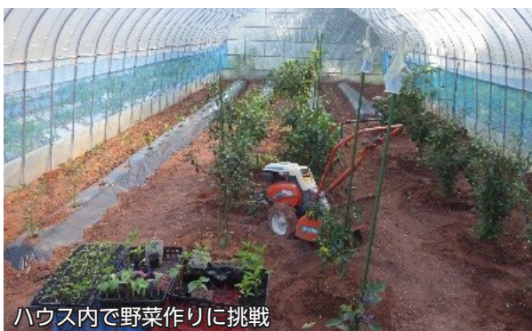
ハウス内で野菜作りに挑戦