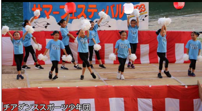
チアダンススポーツ少年団