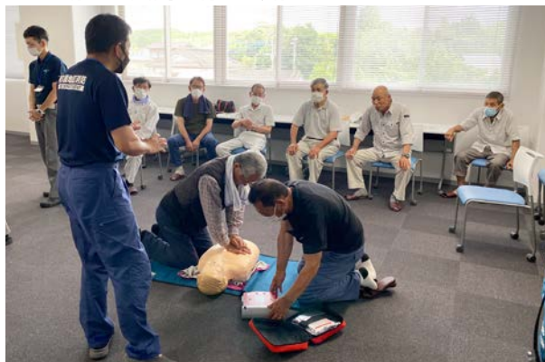
AED講習を真剣に行う受講者

本講習を受講することで、緊急時に対応しやすくなりますので、次回開催にも多数の応募をお待ちしております。