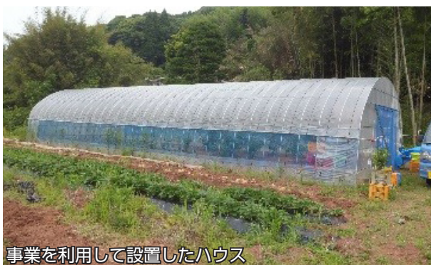
事業を利用して設置したハウス