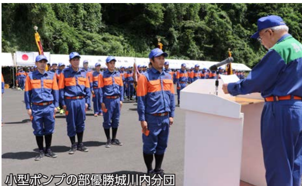
小型ポンプの部優勝城川内分団