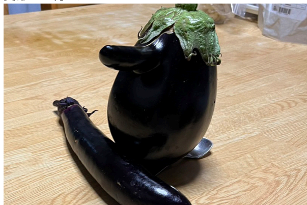
変形して育ったナス