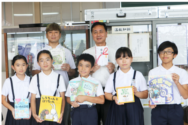
好きな本を手にする児童ら

学校への寄贈は3年目を迎えます。今年度は蔵之元小学校にも寄贈され、今回で町内全ての小学校に寄贈されたこととなります。