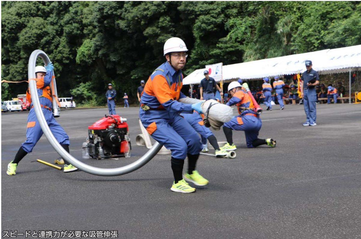
スピードと連携力が必要な吸管伸張

7月2日、火災現場を想定した機敏な規律動作と正確な機械器具操作を競う、長島町消防操法大会が蔵之元港船津平で開催されました。