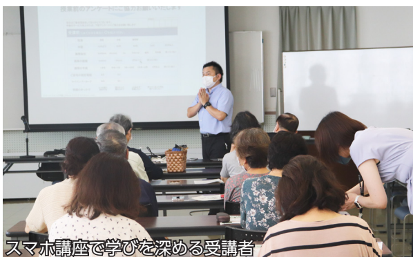
スマホ講座で学びを深める受講者