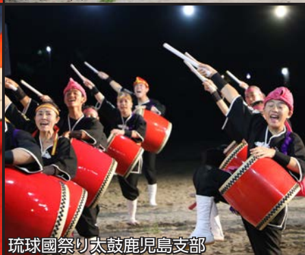
琉球國祭り太鼓鹿兒島支部