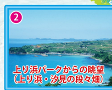
上り浜パークからの眺望 (上り浜・汐見の段々畑)