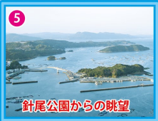
針尾公園からの眺望

あづま海水浴場 サマーフェスティバル 会場 7/29(土) 夏祭り納涼大会 7/30日 プリのつかみ取り大会