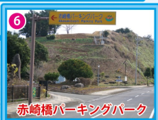
赤崎橋パーキングパーク