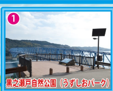
黒之瀬戸自然公園 (うずしおパーク)