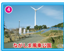
ながしま風車公園