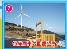
毎床風車公園展望所