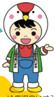
JA鹿児島いすみ マスコットキャラクター 「いづるくん」