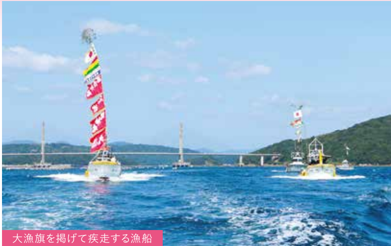
大漁旗を掲げて疾走する漁船