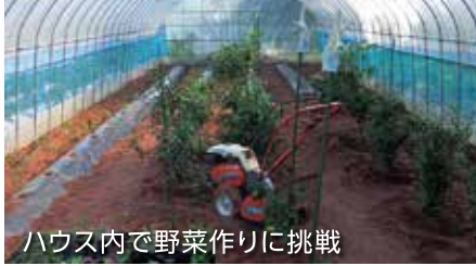
ハウス内で野菜作りに挑戦