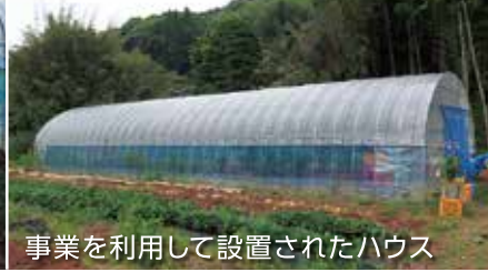
事業を利用して設置されたハウス