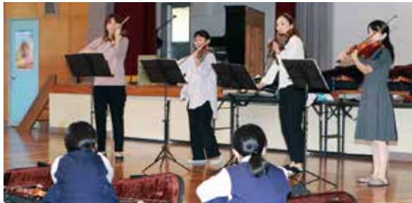
演奏に耳を傾ける生徒ら

10月21日と22日の2日間、町内の小中学校で学校巡回バイオリン体験教室が開催されました。