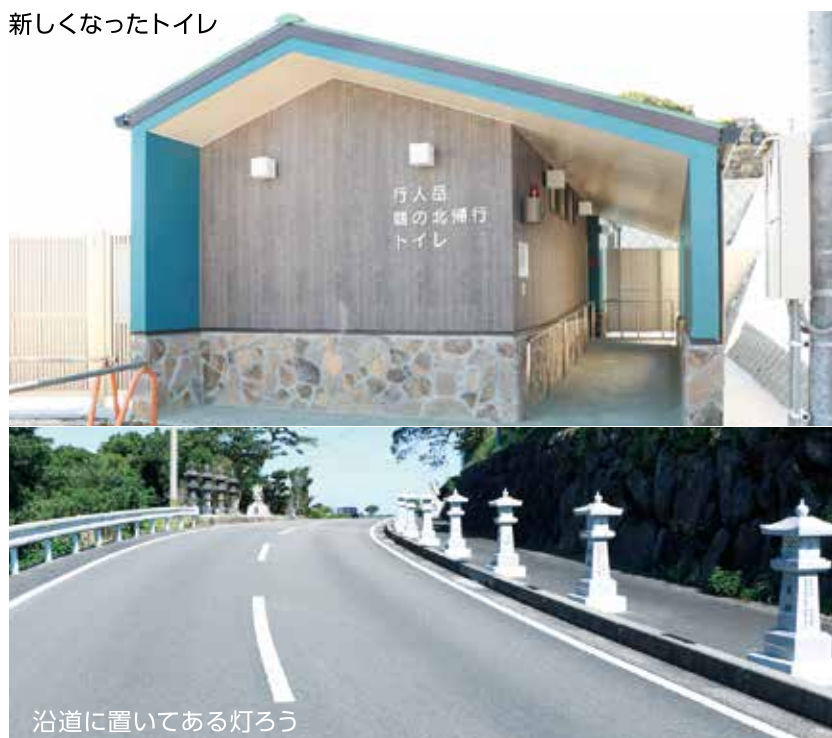
沿道に置いてある灯ろう