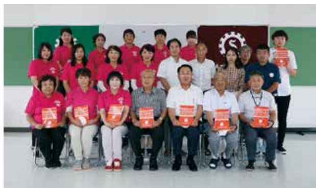
完成を祝う関係者ら

長島町テイクアウト情報誌は、広報紙の9月号に併せて、集落便で各世帯に発送されます。ぜひご利用ください。