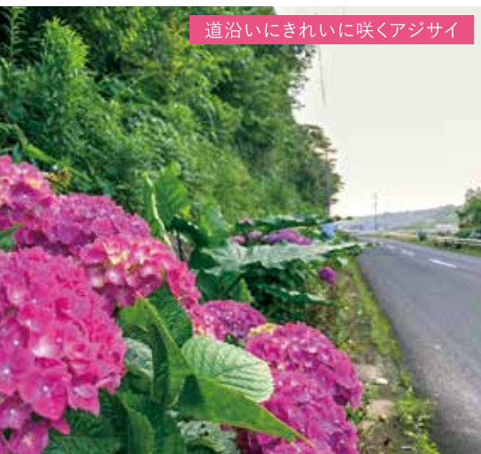
道沿いにきれいに咲くアジサイ