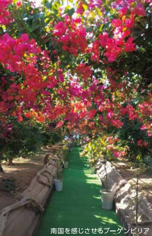
南国を感じさせるブーゲンビリア