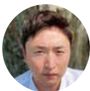
地域おこし協力隊 制作：江副 佑輔

「うぶ声・お悔やみ・お礼」は、 個人情報保護のため掲載していません。 ご了承ください。