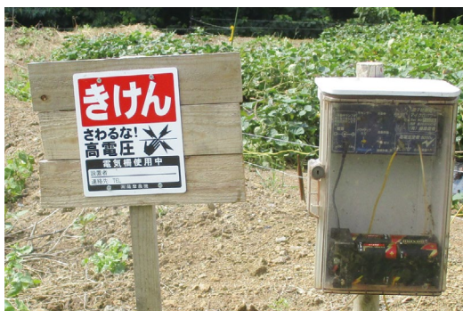
↑注意喚起は見やすい位置と文字で掲示