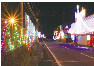
↑最後の輝きをお楽しみに