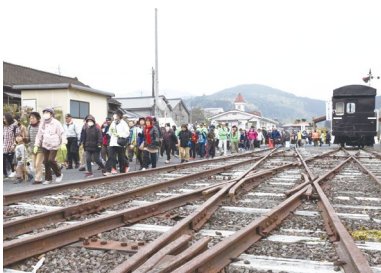
↑菊次郎ゆかりの地を歩く