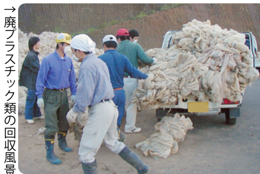
→ 廃プラスチック類の回収風景