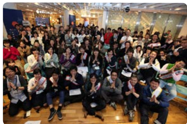
↑全国から集まった食べる通信編集長