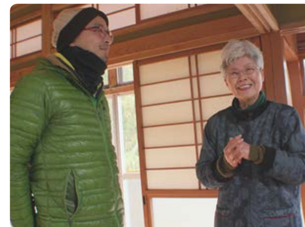
↑リメイク版では、新たな町民が登場しますので、ご期待ください