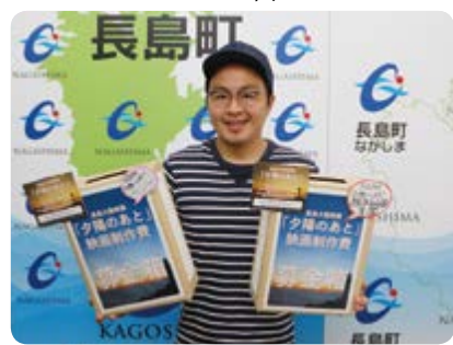
↑募金箱設置にご協力ください