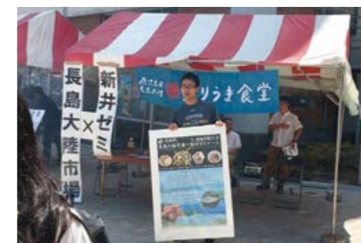
↑長島町をPRする新井ゼミの学生ら

キッチンカーには、多くの人が足を運び、赤土ジャガイモのフライやブリそぼろ弁当など、売売が続き、大盛況となりました。