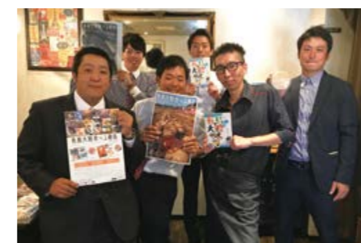
↑フェアを成功に終わらせた生産者らとアンティークの大町シェフ

補助金や助成金に頼らず、同町生産者の協賛などで行った今回の活動を、今後も継続的に実施し、都心部飲食店とのさらなる関係構築を目指します。