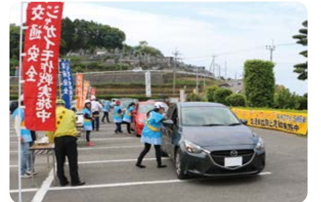
↑運転者に蒸かしジャガイモを配る会員ら

ゴールデンウィーク期間中で、通行車両が増える中、阿久根警察署の誘導のもと、参加者らは「安全運転をお願いします」「交通事故に気を付けて」などと、ドライバーへ蒸かしジャガイモを手渡し、交通事故防止を訴えました。