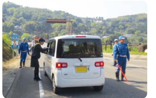
↑安全運転を呼びかけながらアオサを配布