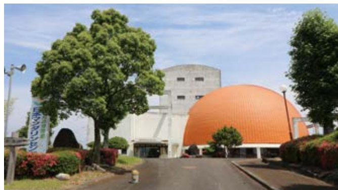
↑入館料が無料となった日本マンダリンセンター