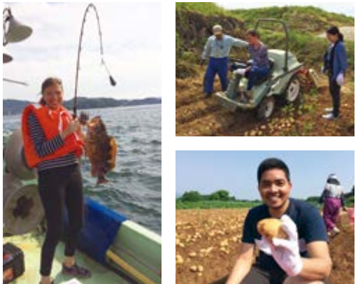
↑さまざまな体験プログラムを楽しむ外国人観光客ら

な国の人が長島の赤土ジャガイモの掘り取りや、養殖場の見学・釣り体験などを楽しみ、交流会をかねたバーベキューでは、地元の子どもたちも参加し、英語での会話に挑んでいました。