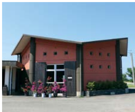
↑指定管理者が決定した川床ふれあい広場施設