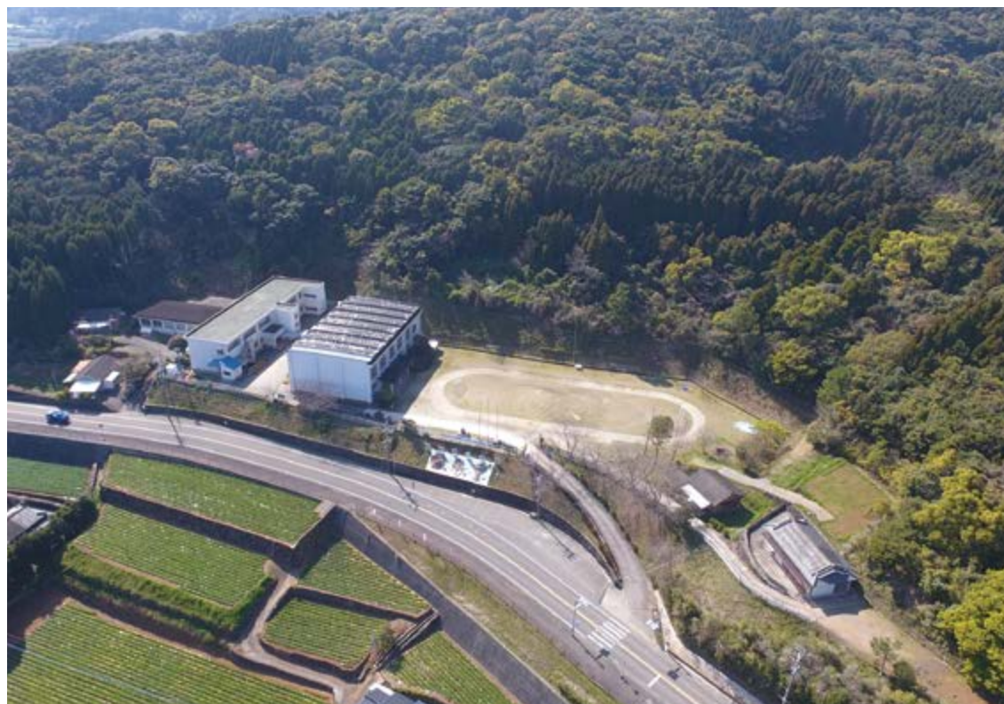
↑売却・無償譲渡が決まった田尻小学校

利用者が減少傾向となっていた日本マンダリンセンターについては、入館料を無料にするなどの条例を改正する議案も上程・可決。町民などが利用しやすい環境が整えられ、今後の利用者数の増加が期待されます。