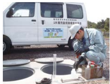
↑ 法定検査を行う検査員

検査対象となった浄化槽（設置年度ごとに対象としています）については事前に指定検査機関から日程通知がありますので必ず受検しましょう。