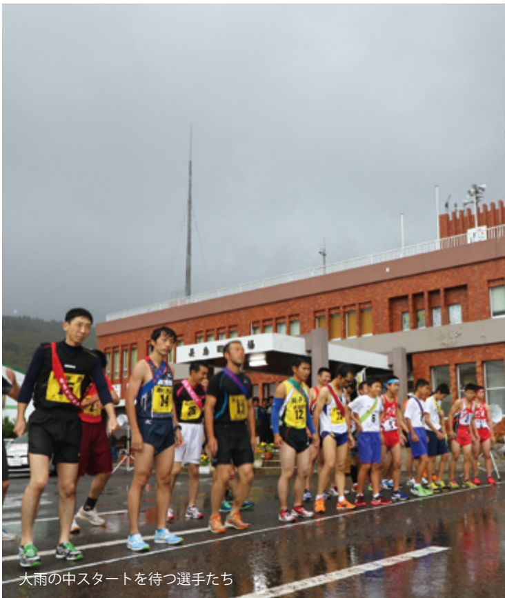
大雨の中スタートを待つ選手たち