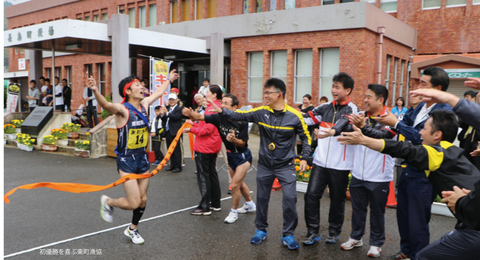
初優勝を喜ぶ東町漁協