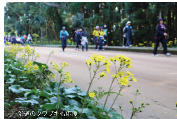
沿道のツワブキも応援

コースは、赤崎橋パーキングパークを折り返す7 キ と、塩追集落を通り川床ふれあいの郷で