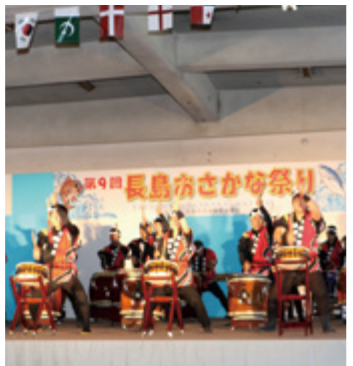
→ 獅子島七郎太鼓によるオープニング