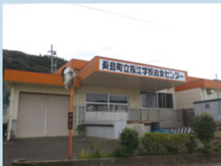
↑売却する旧指江学校給食センター