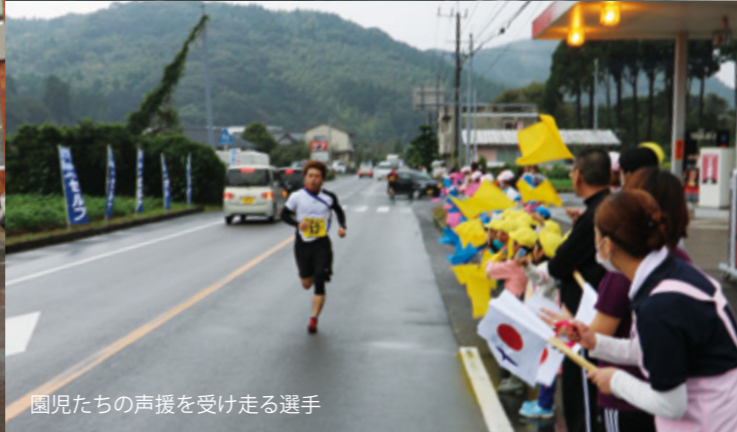
園児たちの声援を受け走る選手