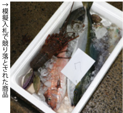
→ 模擬入札で競り落とされた商品