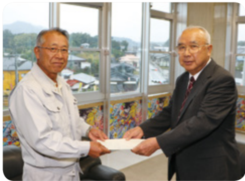
↑川添町長へ答申を手渡す大平委員長