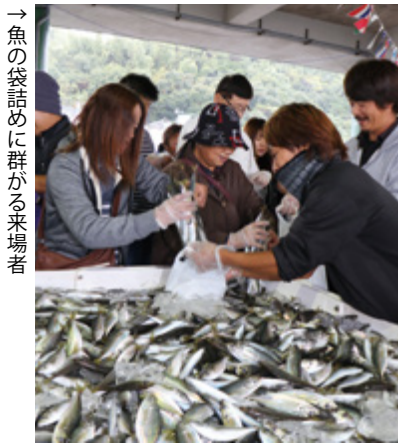
→ 魚の袋詰めには群がる来場者