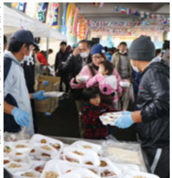
→ 無料で振る舞われたプリ料理

回を重ねるごとに、長島町の新鮮な魚介類が安価に手に入るという評判を呼んできたおさかな祭り。この日は終日雨模様で、来場者は約5千人と例年よりも少なかつたものの、会場は溢れんばかりの人だかりや、元気な声飛び交い大いに盛り上がっていました。