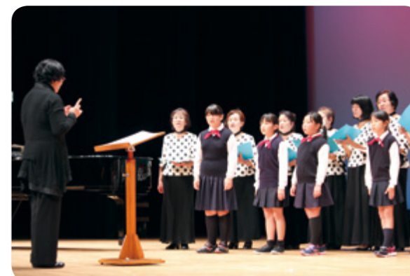
↑前夜祭では町民歌を披露

B&G海洋センター体育館の展示部門では、町内の幼児・小中学生や一般から出品された書道、華道、陶芸、盆栽、手芸品などが並べられ、来場者を楽しませていました。