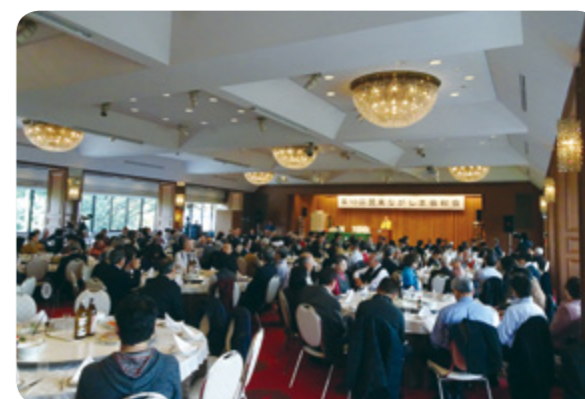
↑町長の近況報告に耳を傾ける会員ら