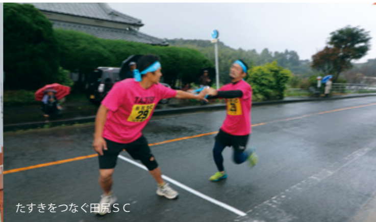
たすきをつなく田尻SC