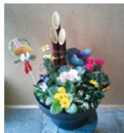
↑ 2,000円 / 1組