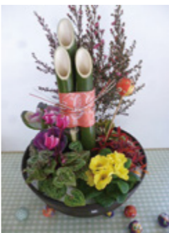
↑ 3,000円 / 1組

花カフェ長島では、いろいろな花を寄せ植えした門松を販売します。 仕事などで忙しく門松が作れない人や門松を飾ってみようと思っっている人など、この機会にぜひ花カフェ長島でお買い求めください。 ○販売期間 12月19日(月)～12月26日(月) 水曜日は定休日 ○時間 午前10時～午後5時