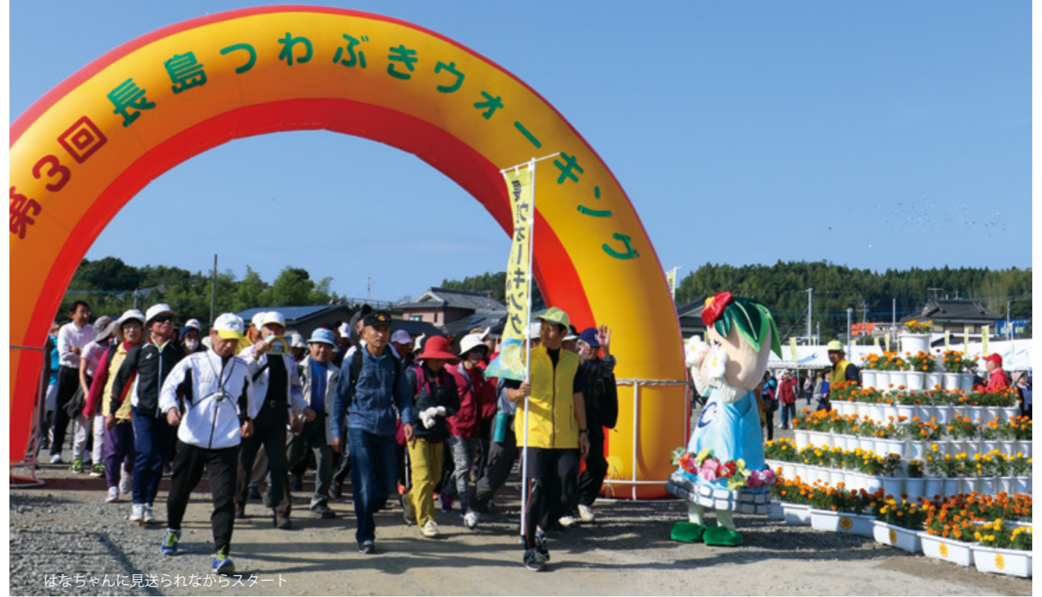
はなちゃんに見送られながらスタート

11月13日、役場前駐車場をスタート・ゴールとする第3回長島つわぶきウォーキングが開催され、町内外から545人が参加しました。