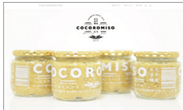
↑完成したホームページのトップページ ( http://cocoromiso.sakura.ne.jp/ )