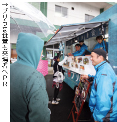
→ プリうま食堂も来場者へPR