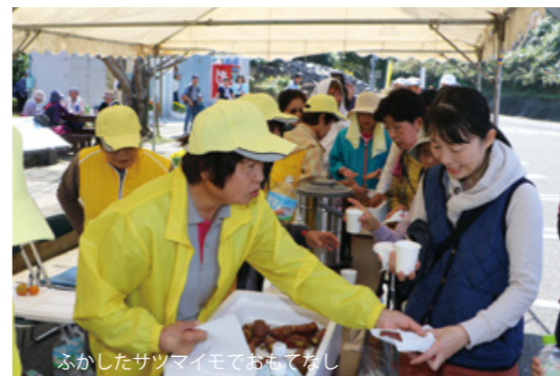
ふかしたサツマイモでおもてなし

各コースの折り返し地点では、ふかしたサツマイモやお茶などが振る舞われ、参加者からはサツマイモをほおばりながら一休みした後、ゴールへ向かって歩き出していました。