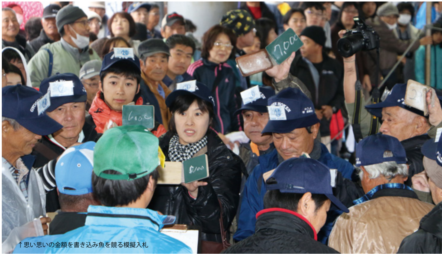
↑ 思い思いの金額を書き込み魚を競る模擬入札