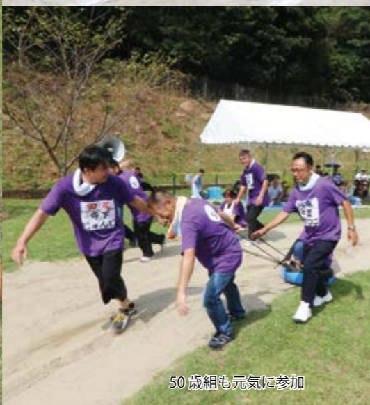
50歳組も元気に参加