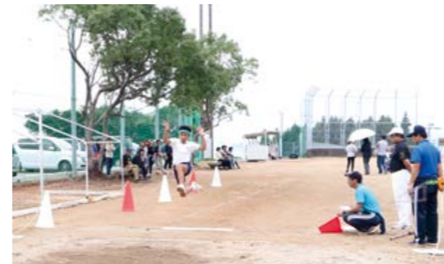
↑大きくジャンプ、走り幅跳び