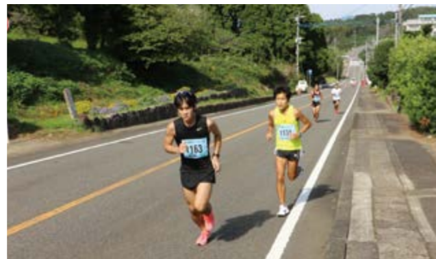
↑急な上り坂を懸命に走る参加者