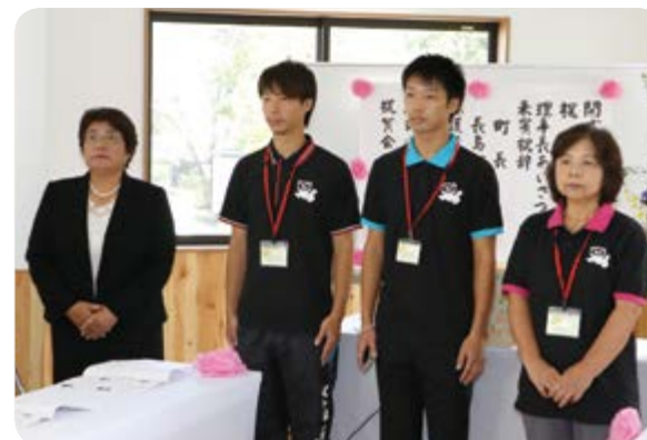
↑完成を祝う大堂理事長(写真左)とスタッフら

大堂理事長は「これまで町内に療育施設がなかったことから、支援の必要な子どもと保護者は町外へ通わなければならなかった。今回、この施設を整備したことで、子どもたちに安心して笑顔で走り回れるような環境を作り、少しでも保護者らの手助けをしていきたい」とあいさつしました。