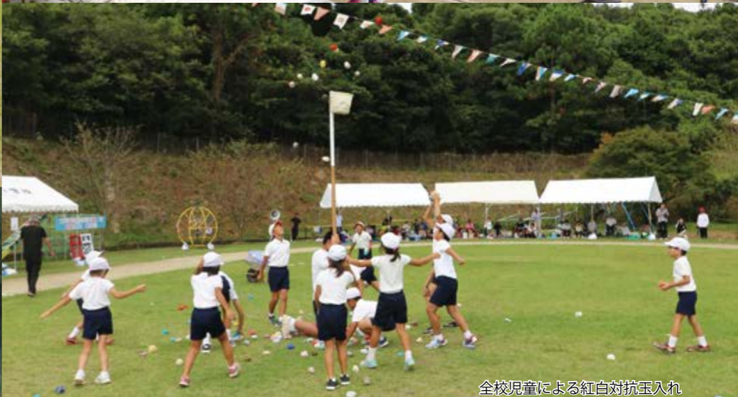
全校児童による紅白対抗玉入れ