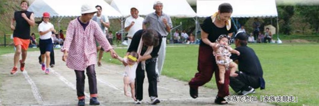
家族で参加「家族徒競走」