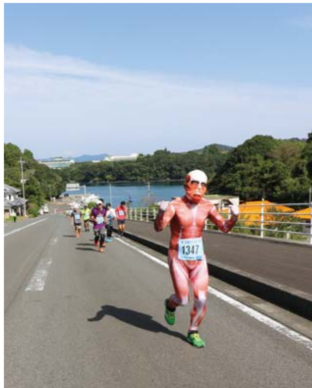
↑コスチュームを着て走る参加者