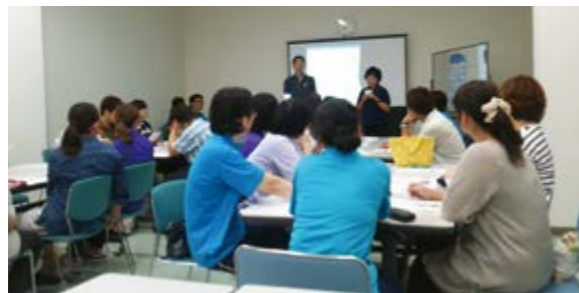
↑サポーター養成講座の様子

認知症サポーターは、認知症を正しく理解し、認知症の人や家族を見守る「応援者」です。地域住民をはじめ、介護施設の職員、町内の消防団員なども講座を受講し、地域全体で認知症に対する理解を深め、誰もが安心して住みやすい地域づくりに取り組んでいます。