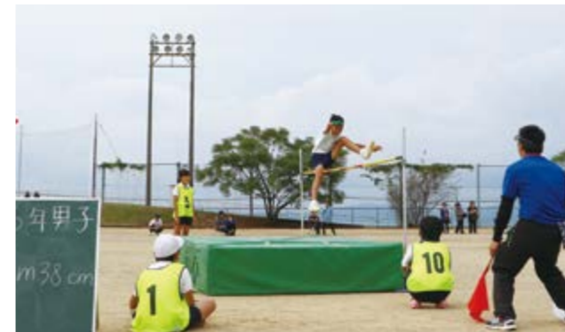
↑記録更新を目指し高々とジャンプ