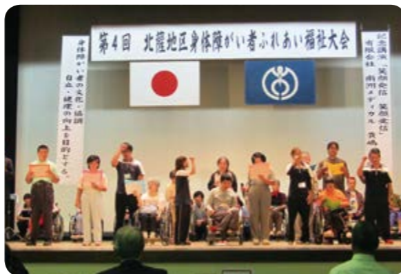
↑施設入所者による演奏を披露

午後の部では文化行事の披露が行われ、近隣の障がい者福祉施設の入所者による演奏や、阿久根警察署「うずしお劇団」によるうそ電話詐欺防止啓発の寸劇などが披露されました。