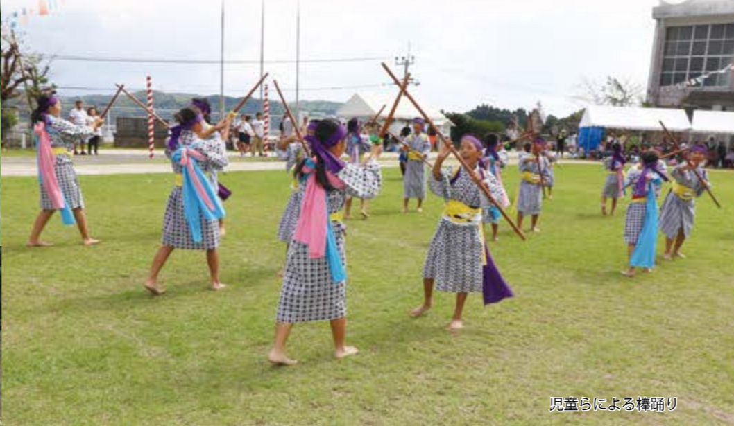
児童らによる棒踊り