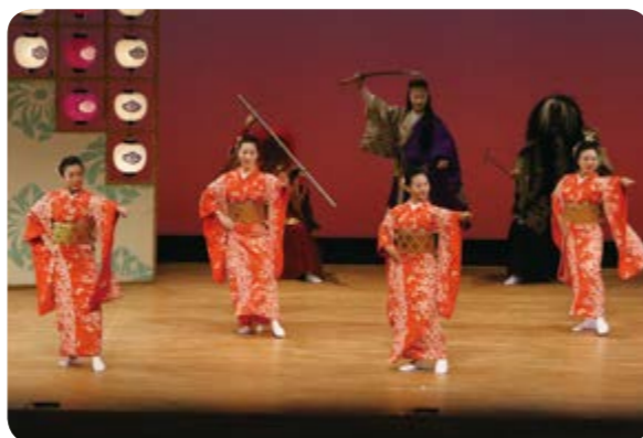
↑華やかな踊りで観客を魅了

公演が終わると、ロビーで待ち受ける演者らに「想像以上におもしろかった。また観に行きたい」と観客が握手を求め、日本を代表する演舞に満足した様子でした。