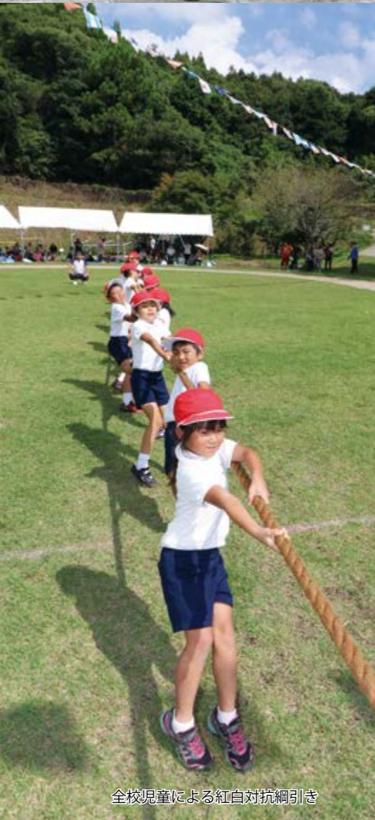
全校児童による紅白対抗綱引き