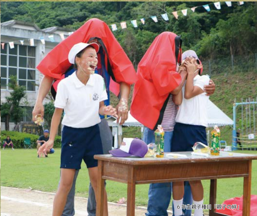
6年生親子種目「親子の絆」