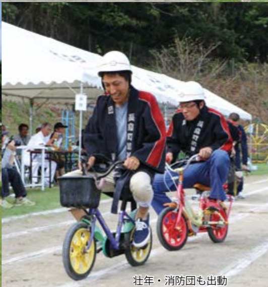
壮年・消防団も出動