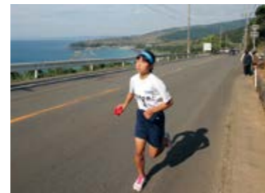
↑上り浜を駆け上る選手