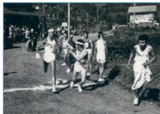
↑昭和39年第9回大会(赤崎～山門野7.4km)