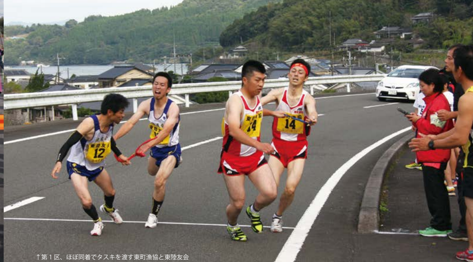
↑第1区、ほぼ同着でタスキを渡す東町漁協と東陸友会