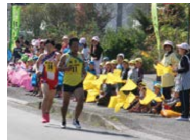
↑沿道からの元気な応援

写真展「長島一周駅伝60年のあゆみ」 町制施行10周年・第60回特別事業として、長島一周駅伝にまつわる思い出の写真や資料などの提供を呼び掛けたところ、約70点の提供がありました。これらの写真を一堂に集めた写真展が長島町開発総合センターと役場指江庁舎で行われました。