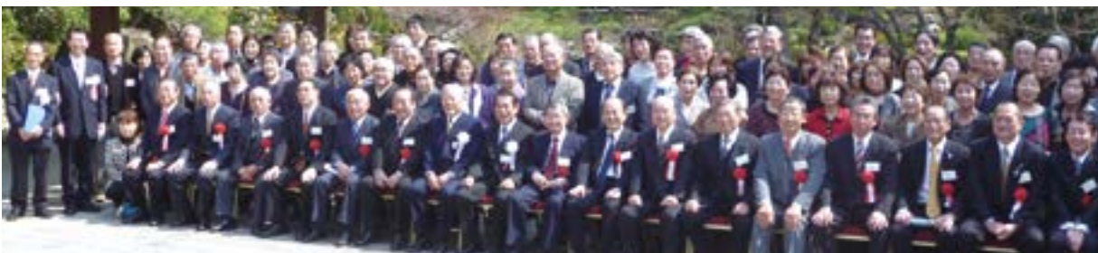
↑ 第7回交流会に参加した会員の皆さん