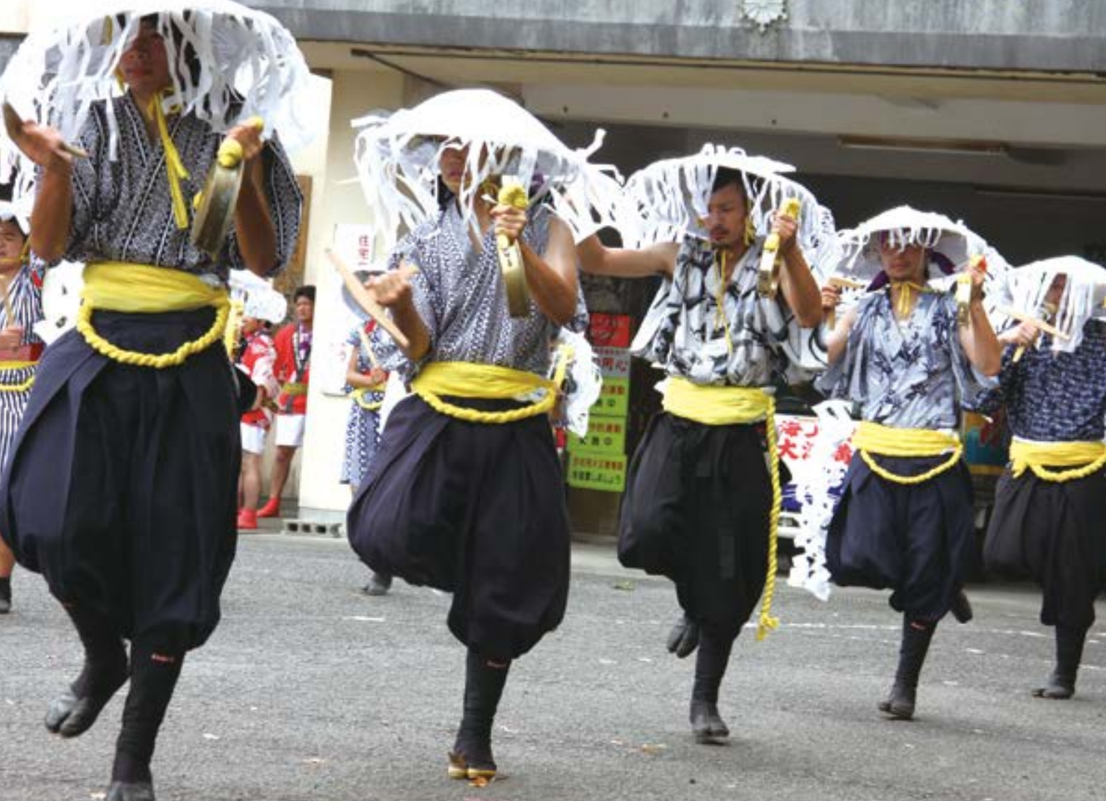
↑浦底鉦踊り保存会による鉦踊り（鷹巣八幡神社）