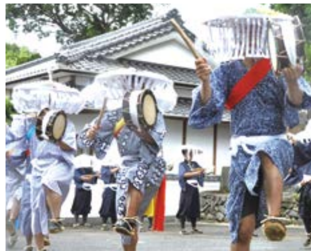
↑城川内集落に伝わる鉦踊り（同集落堂崎城跡）

8月8日、長島町に伝わる御八日踊りが町内の各集落で奉納されました。踊り手たちは、甲高い鉦の音や力強い太鼓の音にあわせて歌やおはやしを響かせ、無病息災を祈りました。