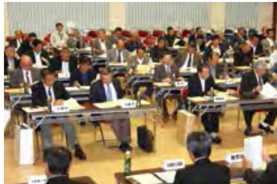
↑行政連絡員会議の様子