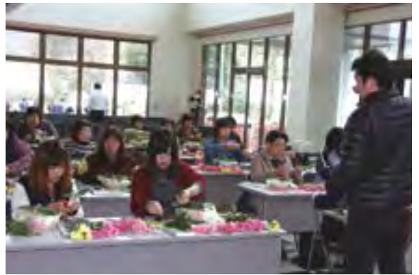
↑講師の手ほどきを受けながら花を生けるフラワーアレンジメント教室の参加者