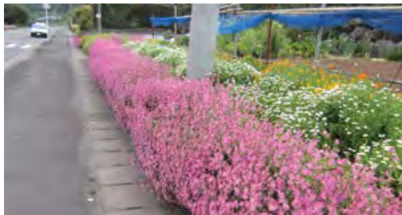
↑ピンク色の花が鮮やかなフクロナデシコ

beautiful island and a wonderful island. * *