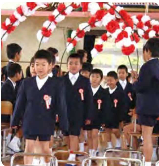
↑花のアーチをくぐる新入生

広報誌への問い合わせ、取材依頼は… 役場企画財政課広報統計係 ☎ (86) 1134 [直通]