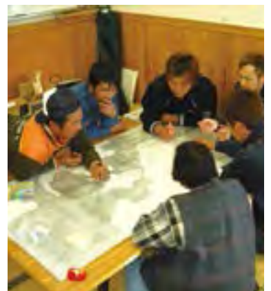
↑町民一体でハザードマップの作成