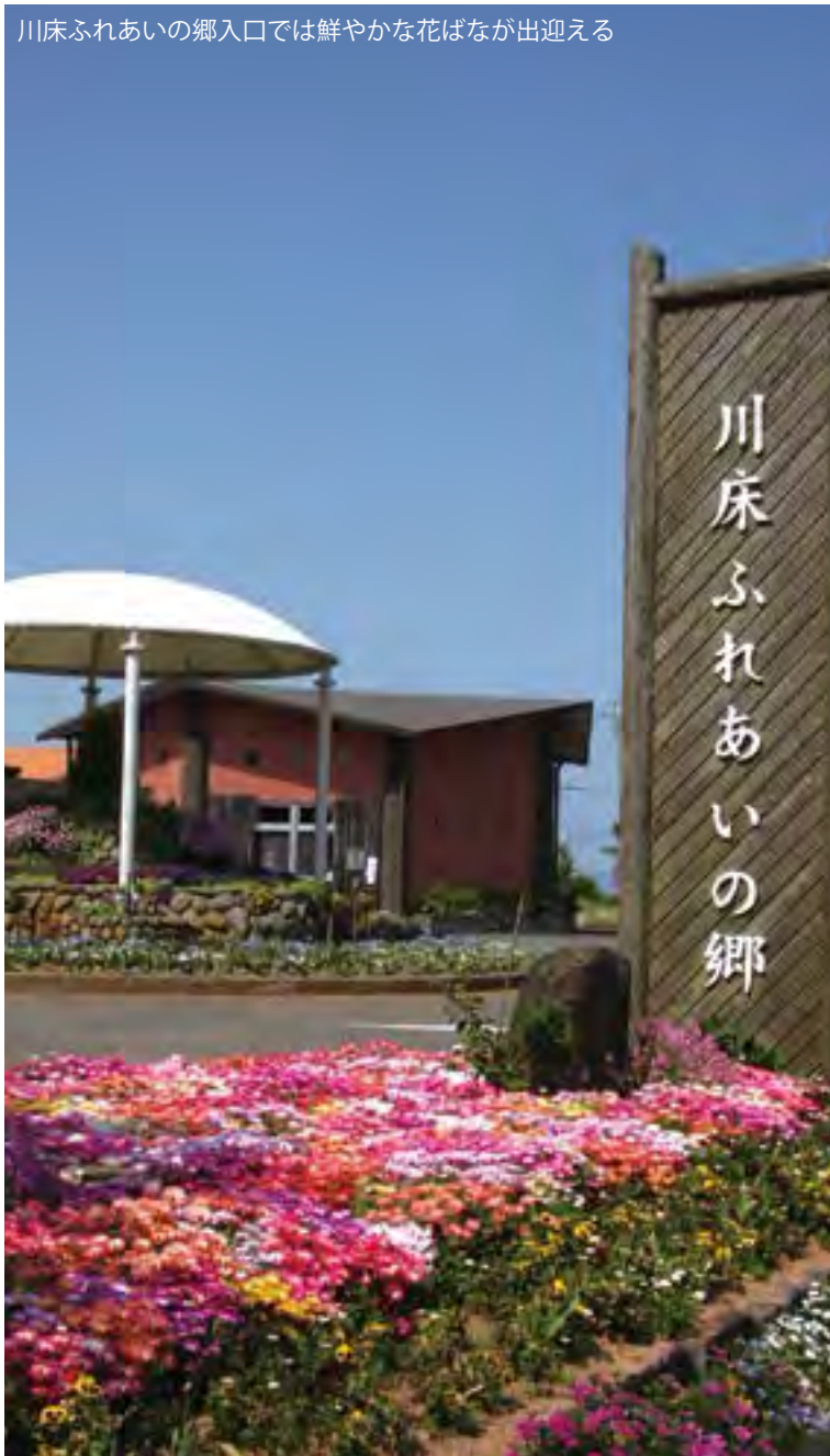
川床ふれあいの郷入口では鮮やかな花ばなが出迎える