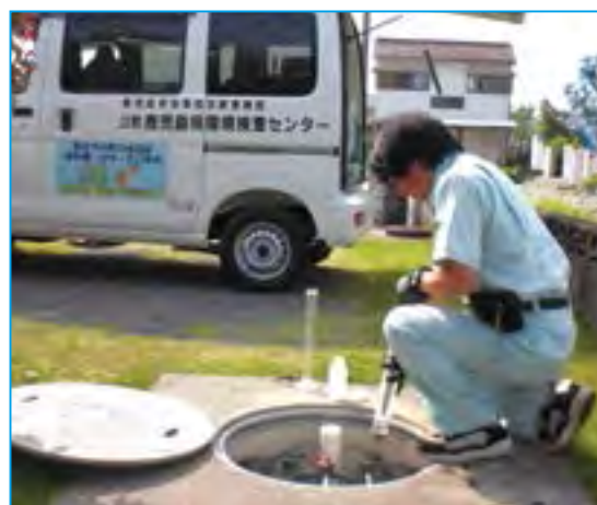
↑法定検査を行う検査員