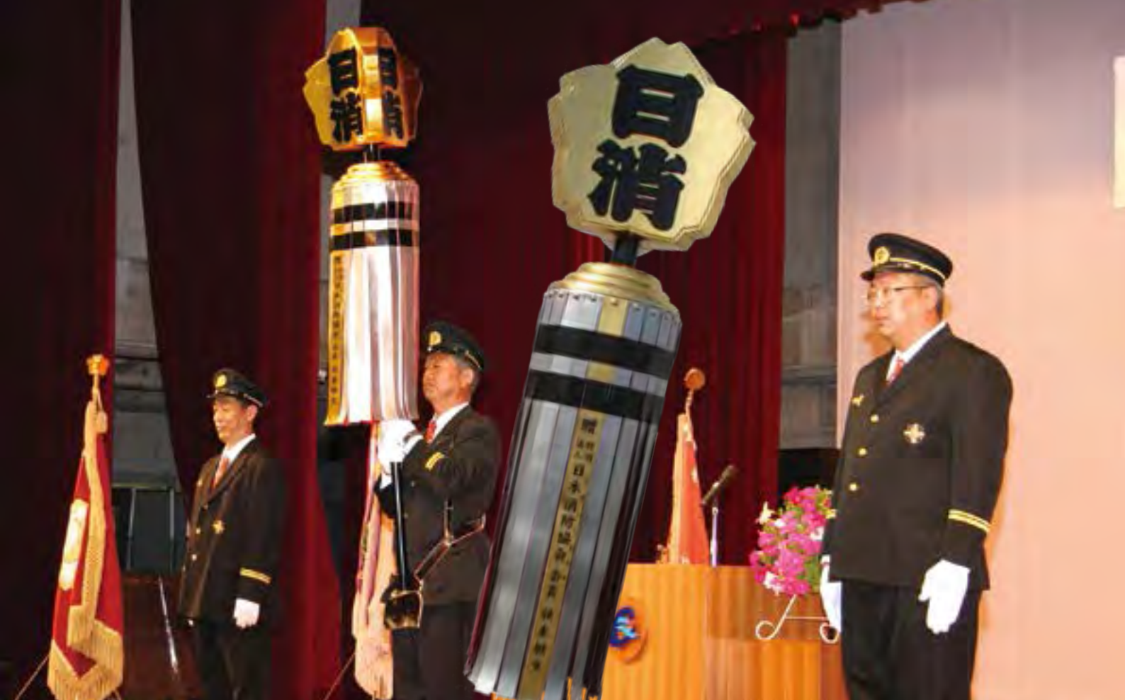
←「まとい」は長島町役場1階ロビーに展示しています