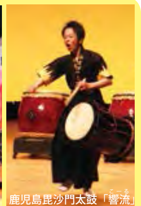
鹿児島毘沙門太鼓「響流」