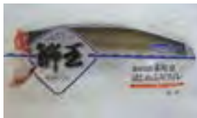
↑町特産のデコポンと鰯王 (フィレ)