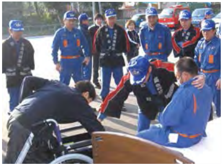
↑特色を凝らした消防団の合同訓練

鹿児島県大会で4回の優勝を誇る長島町消防団ですが、県大会で優勝しても全国大会への出場がない年があるため(県大会は隔年で実施され、全国大会はポンプ車の部と小型ポンプの部が交互に出場)、全国大会への出場はまだまだ果たせていません。