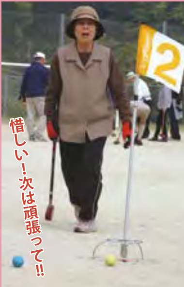
惜しい！次は頑張つて！！