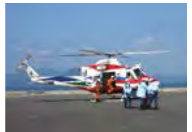
↑平成21年に行われた防災訓練の様子