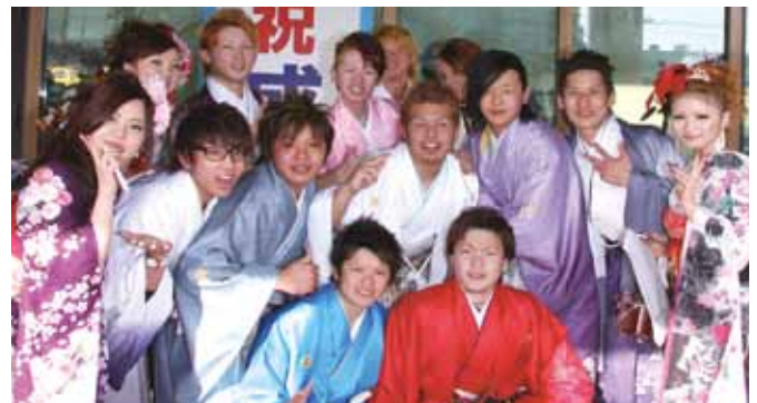
↑仲間と一緒にハイ、チーズ！