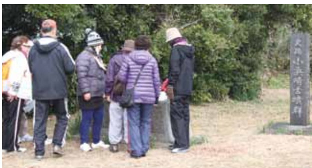
↑コース途中の古墳を見学する参加者（6 キロ コース）