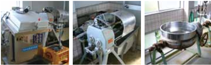
施設内にあるさまざまな加工機器

町では、農畜産物処理加工施設を指定管理者として管理運営する、法人およびその他の団体を募集します。 農畜産物処理加工施設は、町内で生産される農畜産物などを加工し、付加価値をつけて販売することで、人と町の活性化に寄与することを目的としています。 自らの創意工夫で加工品の新規開発や食農教育を図り、人と町の活性化に取り組んでみませんか。