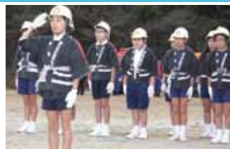
↑蔵之元小学校少年消防クラブによる通常点検