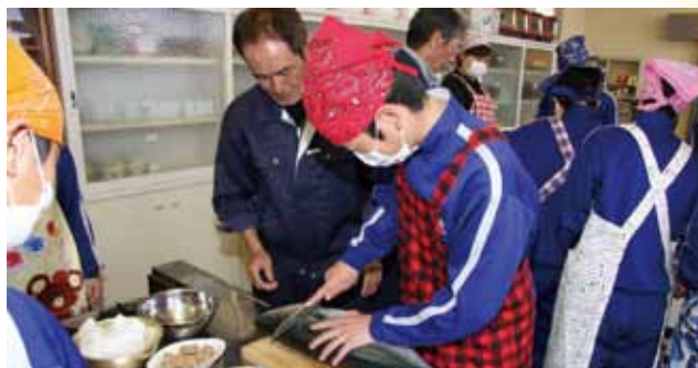
↑養殖業者会員の手ほどきを受け、ブリをさばく生徒ら