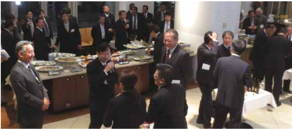
→和やかな雰囲気で行われたレセプションの様子

長島町の特産品であるブリ、アオサ、バレイショ、デコポンなどの販売促進を図るため、1月15日、東京都港区のセレスティンホテルで平成25年度「ながしま美味でー」が開催されました。