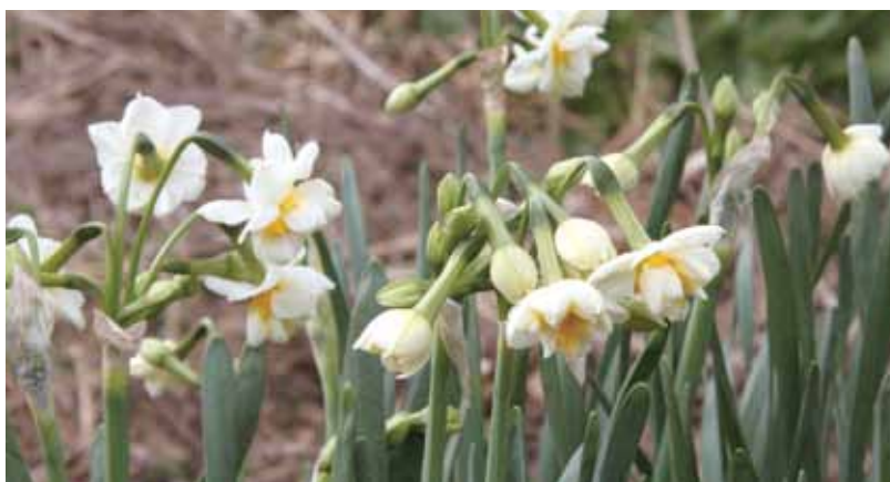
↑白い可憐な花を咲かせる、町花スイセン

beautiful island and a wonderful island. * *