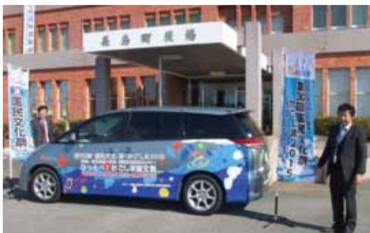
↑指江庁舎を訪れたキャラバン隊

私たちは、劇団四季ミュージカル「桃次郎の冒険」を応援します。～長島町子ども会育成連絡協議会～