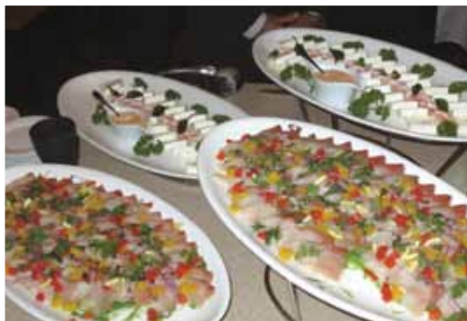
↑鯛王を使った「鯛王のカルパッチョ」などの豪華な料理