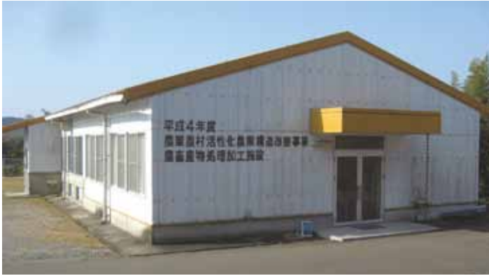
↑指定管理者を募集する農畜産物処理加工施設