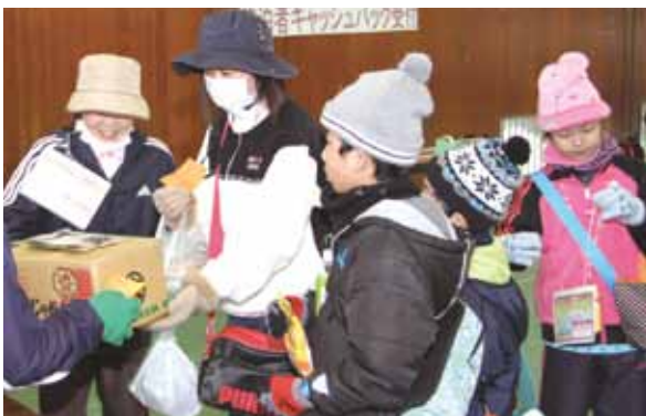
→ゴール後はお楽しみ抽選会