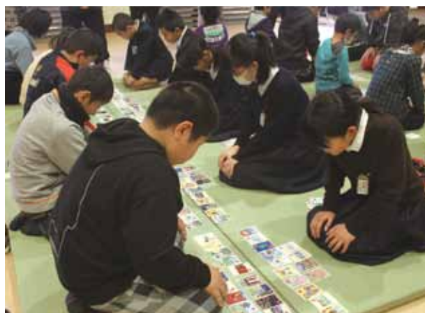
↑ 真剣な表情でかるたを見つめる児童ら