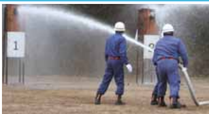
↑会場を沸かせた放水競技