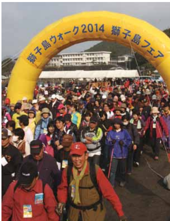
↑一斉にスタートする参加者