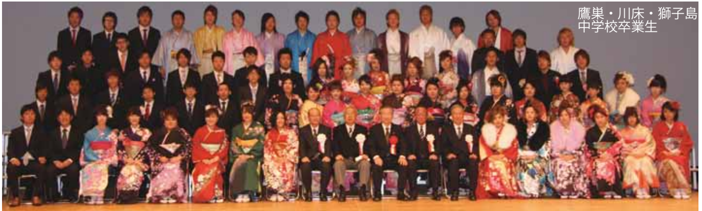
鷹巣・川床・獅子島 中学校卒業生