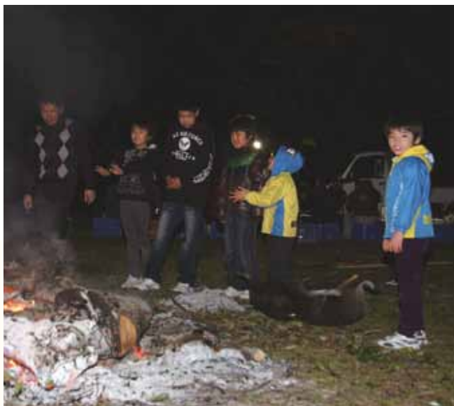
↑ 鬼火で暖をとる親子連れら（浦底）