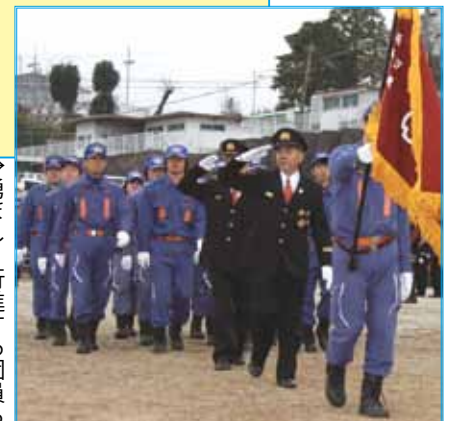
→勇ましく行進する団員ら