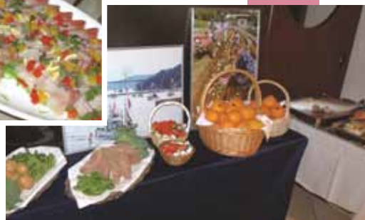
↑会場前に特産品を並べてアピール