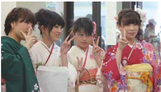
↑笑顔で記念撮影する新成人