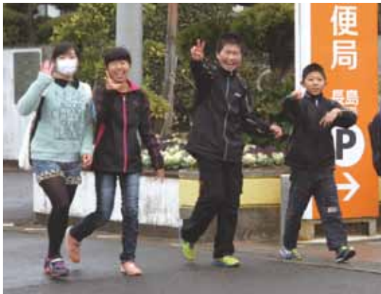
→元気いっぱい笑顔みせる子どもたち（12 キロ コース）