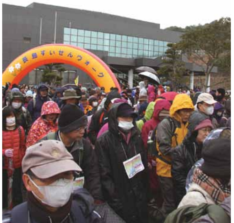
↑傘やかっぱで雨をしのぎながらのスタート