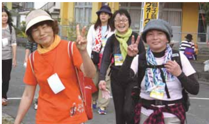
↑ゴール後は疲れも吹き飛び、みな自然と笑顔に