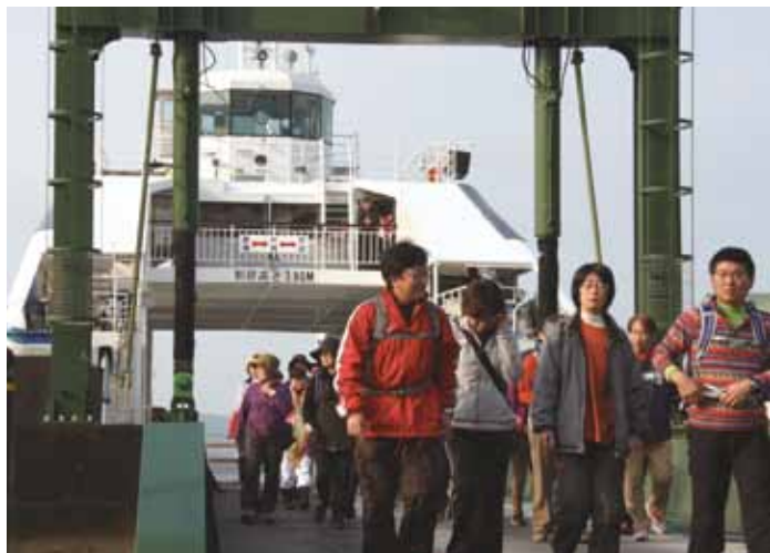
↑天長フェリーを降りて、ぞくぞくと入島する参加者