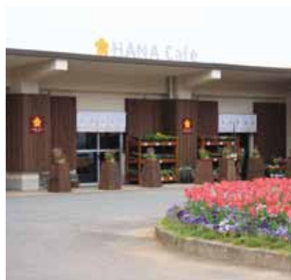
↑ 3月にオープンした花カフェ長島

beautiful island and a wonderful island. * *