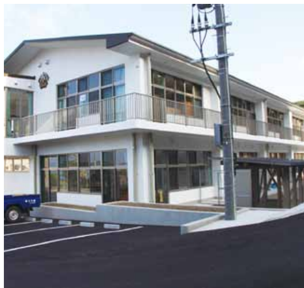
↑獅子島中学校内に建設された新「獅子島小学校」