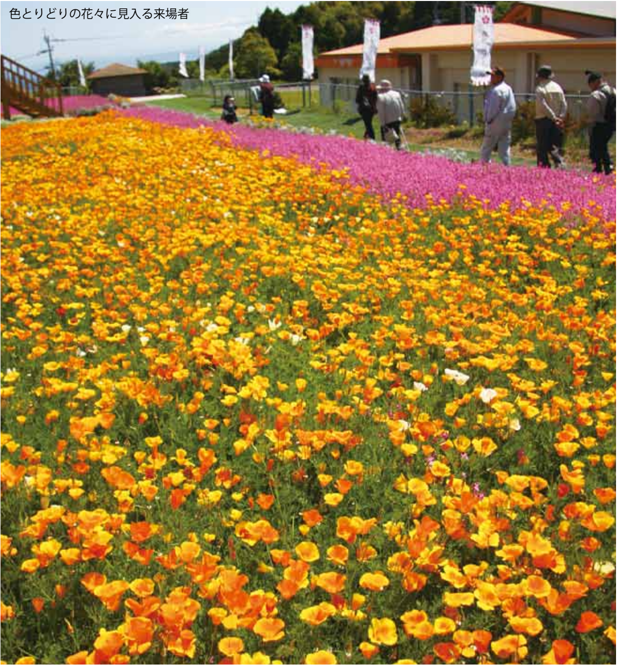
色とりどりの花々に見入る来場者