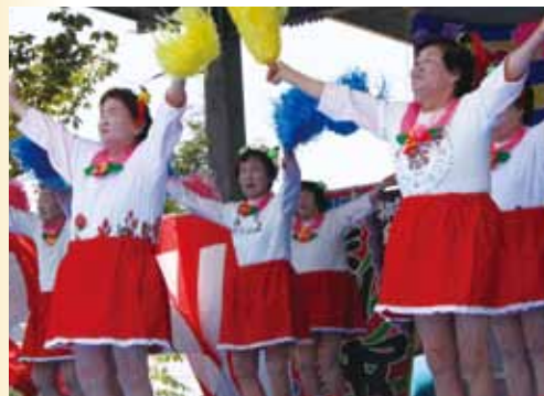
← ダンスを披露する 獅子島デイサービス 利用者の皆さん