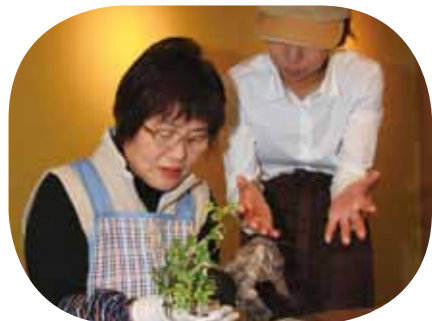
花カフェスタッフが指導する「こけ玉づくり」←