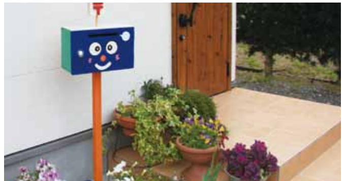
↑下平さん宅前に置かれた手づくりのポスト

4月16日から町内の全ての小学校で出前授業が開かれ、特産品をモチーフにした「ボンタン刑事とマンダリン巡査」が登場する紙人形劇では、防犯対策「いかのおすし」をPRしました。独自のキャラクターたちに児童たちは興味を引きつけられました。このほか、こども110番の家の紹介と鹿児島いずみ農業協同組合から防犯ブザーのプレゼントもありました。