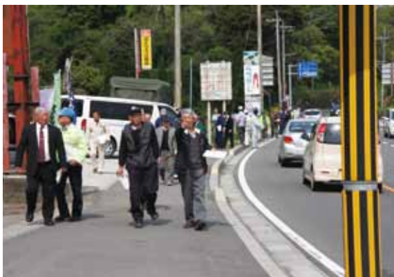
↑真剣なまなざしで点検を行う参加者

歩道の広さや標識の位置などを歩いて点検し、地域の活性化や、高齢者、児童らの往来について、安全を再確認しました。