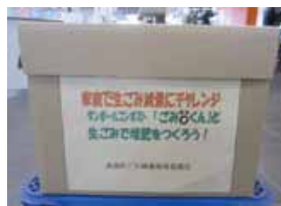
↑ダンボールコンポスト