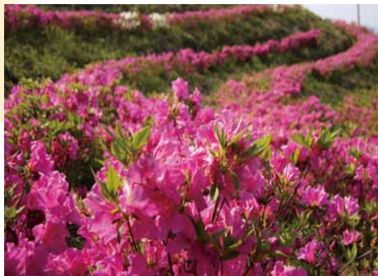
見頃を迎えた七郎 山のツツジ↓