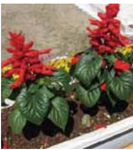
↑花フェスタ会場に咲くサルビアの花

梅雨に入る頃までに大きな株の苗に育てることが大切です。できるだけ5月のうちに苗を確保し、花を摘んで植えると株が大きくなります。病害虫の発生しやすい時期ですので予防をしましょう。