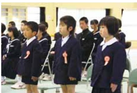
↑真新しい制服に身を包んだ新1年生