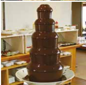
↑好きな料理が 選べるランチバ イキング