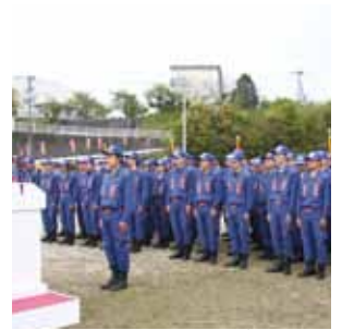
↑新入団員へ辞令が交付される