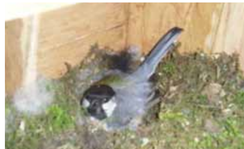
←ポストの中で卵を温めるシジュウカラ