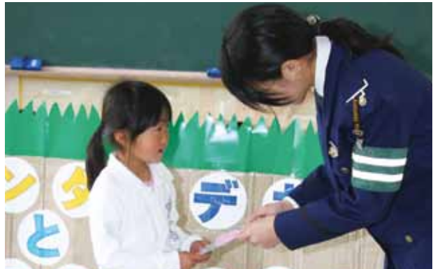
↑防犯ブザーのプレゼント（本浦小学校）