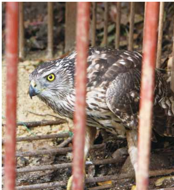
↑ イノシシわなに迷い込んだオオタカ

取材後オオタカは、わなから放すと遠くの大陸を目指し、元気よく飛び立っていきました。