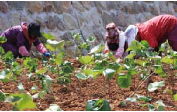
↑1本ずつ丁寧にツワブキを植える作業員の皆さん

今回植え付けられたツワブキは町内で採取したのですが、今後は全都道府県のツワブキを集めて植栽する予定です。