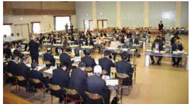
↑ 57地区の行政連絡員が集まった会議