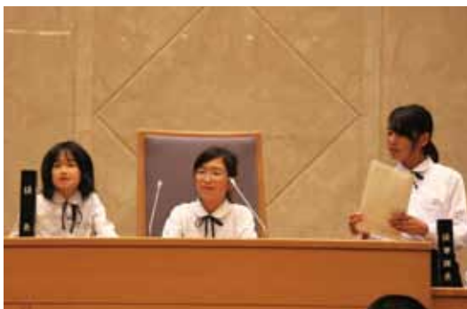
↑普段入ることができない知事室で、伊藤知事と話しをする笑顔の生徒たち