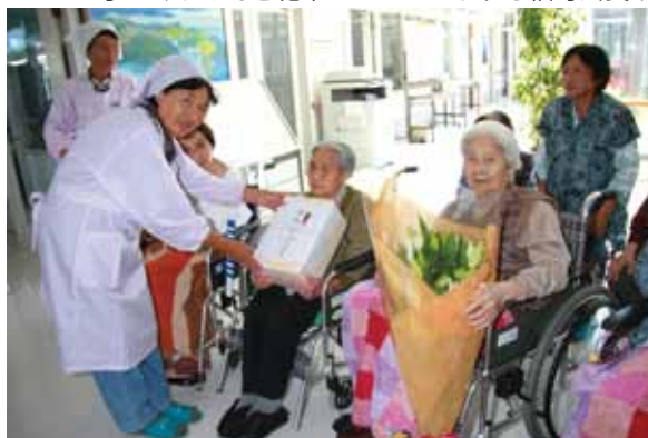
手づくりみそと花束をプレゼントする福寄会長↓