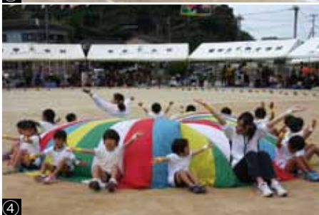
①堂々とした入場行進を行う児童たち ②赤組、白組合同の息のあった応援合戦 ③ゴールする幼稚園児のかけっこ ④幼稚園児らによるかわいいバルーン体操 ⑤へぐしソーランを踊る児童とPTA、地区住民ら ⑥観客席から笑いと拍手がわいた仮装行列