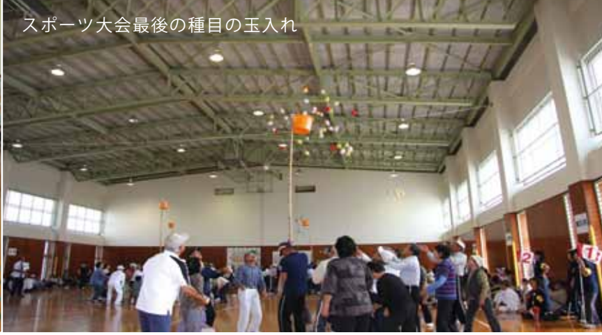
スポーツ大会最後の種目の玉入れ