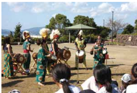
↑勾玉づくりで原石に下書きをする子どもたち