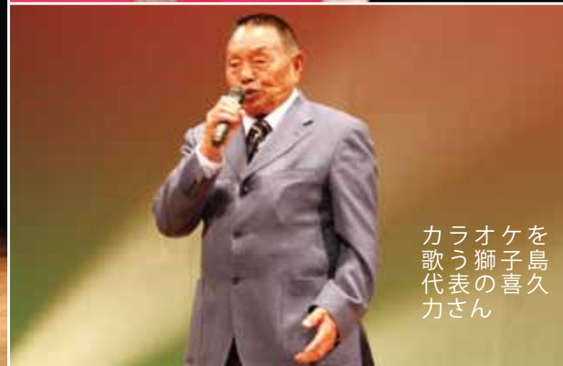
を島久 ケ子喜 オ獅の ラう表 カ歌代 力さん