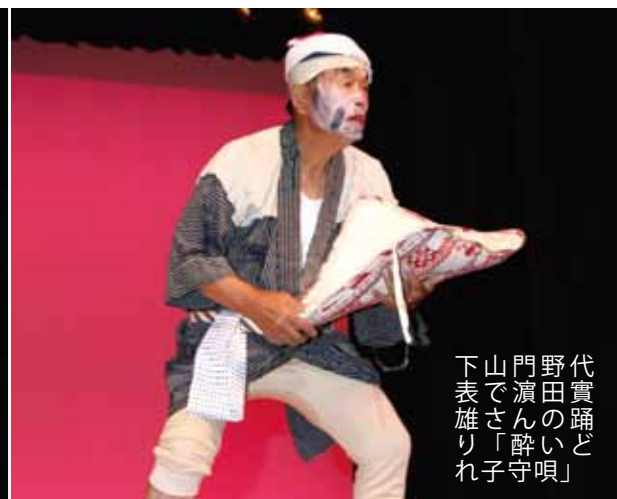
代実踊ど 野田のい 門濱ん酔 山でさ「 下表雄り れ子守唄」