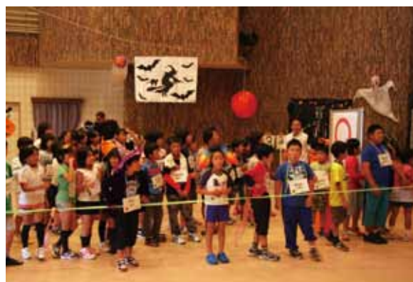
↑仮装ゲームで海賊などに見事に変装し、会場は大盛り上がり