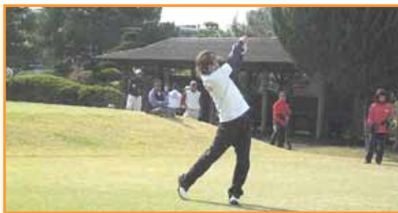
親睦を深めた大会の様子↑