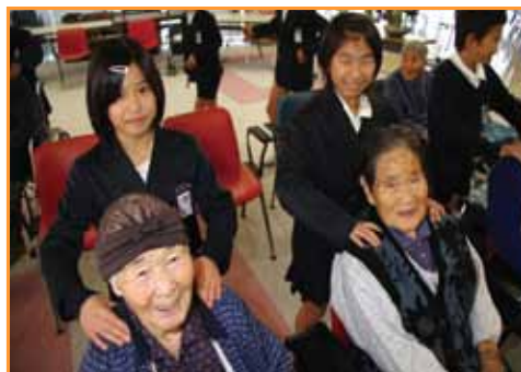
←児童らの肩もみのプレゼントで喜ぶ入所者ら