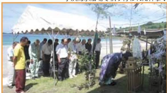
小浜海水浴場で執り行われた神事↓