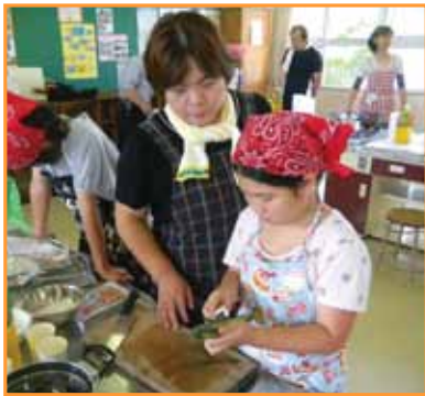
←料理の手ほ どきを受ける 児童ら