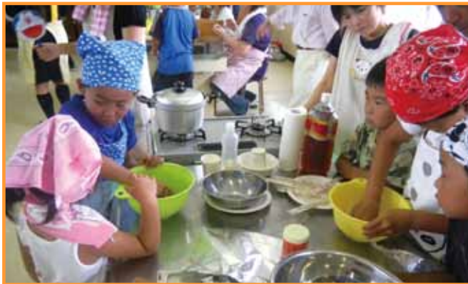
↑わきあいあいとした 中での親子調理教室