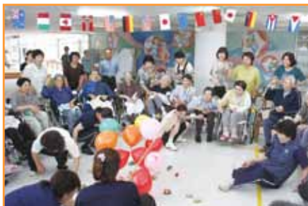
←家族と共に参加し風船を割る競技「桃源郷鬼退治」