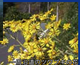
一周沿道のツワブキの花