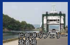
片側港のフェリー発着場