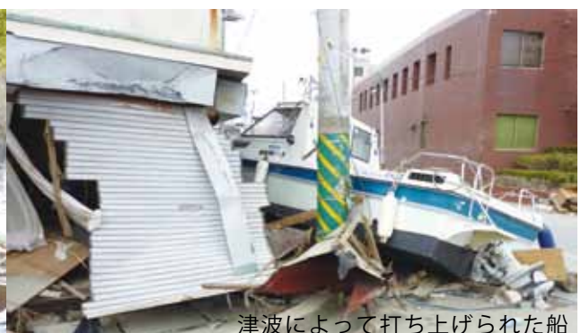
津波によって打ち上げられた船