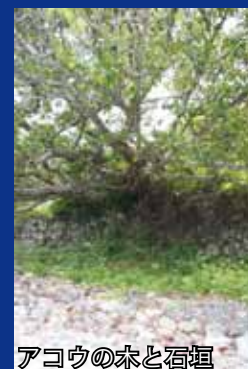
アコウの木と石垣