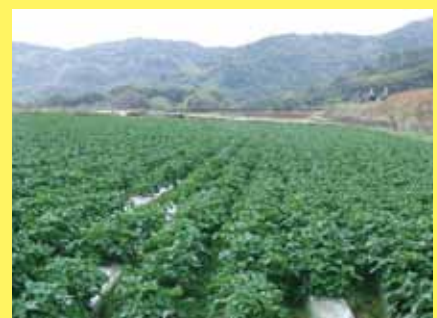
↑実証試験中のほ場 (4月中旬)