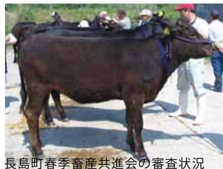
長島町春季畜産共進会の審査状況