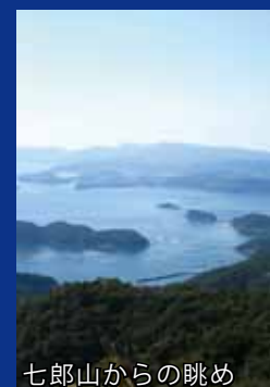
七郎山からの眺め