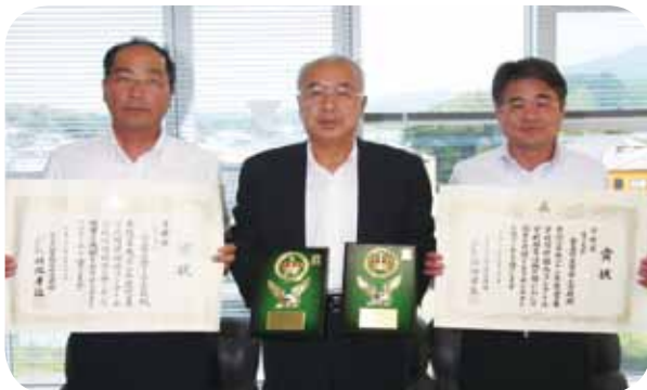
↑受賞の報告に両校長が町長室を訪問

幣串小学校は、約20年前から同校近くにある無人島「ひょうたん島」を学校林として活用し、自分が気に入った木を「マイツリー」として6年間観察し、育てていることが全国でも珍しい取り組みだということで評価されたものです。両校長は「長年やってきた結果で大変うれしい。今後も継続していきたい」と抱負を語りました。