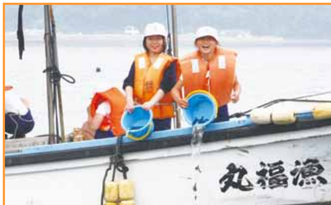
鷹巣小のヒラメの放流↑