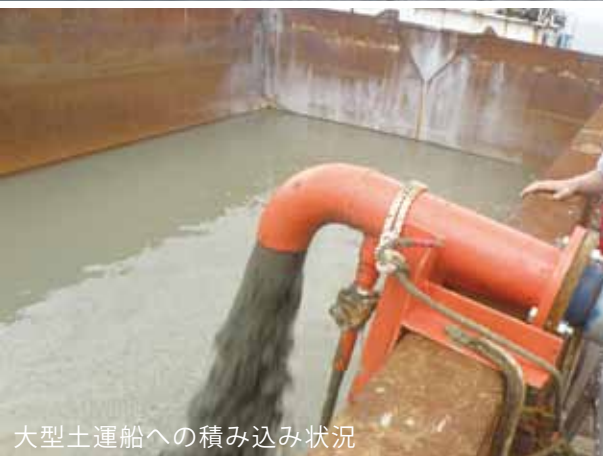
大型土運船への積み込み状況

平成 21 年、22 年と 2 年連続で発生した本町の赤潮被害の抑制のため、6 月上旬から長島周辺海域で赤潮対策底質改善実証事業を実施しました。この事業では、鹿児島県が実証試験として赤潮被害が特に甚大で、シスト（赤潮の発生源となる休眠細胞）分布が多い海域の伊唐地区および脇崎地区の 2 カ所が対象となりました。作業工法は、250 t 吊クレーン船に、海底土砂の表層部分 10 cm をポンプで吸い上げる除去装置サブマリンクリー