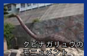
クビナガリュウのモニュメント