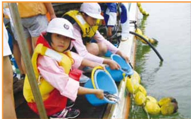
伊唐小児童のマダイの放流↓

この日は、事故を減らすようにポケットティッシュやお茶、長島特産の赤まきなどが200個準備されました。午前10時から始まったこのキャンペーン、駐車場では長島方面から黒之瀬戸を渡る全車両を止め「交通事故には気をつけて」と声をかけながら窓越しに渡していました。大型トラックの運転手は「ありがとうございます。交通事故を起さないよう、あわないよう気持ちを引き締めたいと思います」とお礼を言っていました。