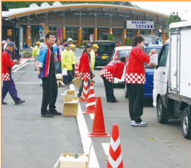
関係者が一台づつ声をかけ事故防止を図る↑