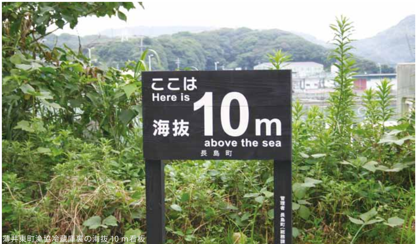
薄井東町漁協冷蔵庫裏の海拔 10 m看板