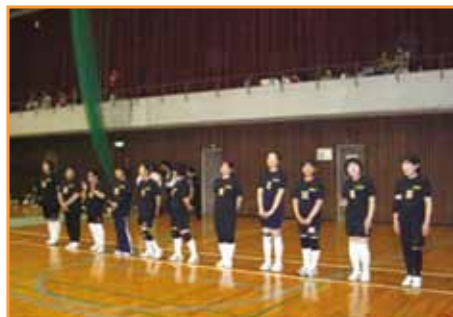
←北薩地区代表の長島町商工会女性部の選手ら