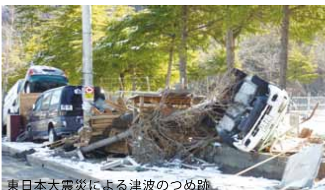
東日本大震災による津波のつめ跡

日ごろから、安全に避難できる高台などを、自主防災組織や家族で決めておくことが重要です。本町でも、津波に対する一次避難場所の指定や、津波ハザードマップの作成など、今後も津波対策を進める計画です。