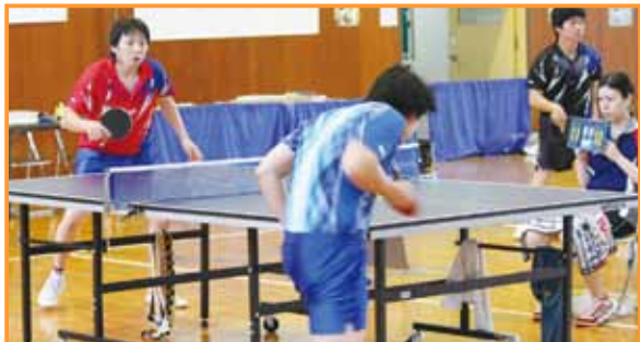
熱戦が繰り広げられた会場内↓

運動会会場となった食堂ホールでは、万国旗などで飾られ、ボトル倒し競争やスプーンレース、桃源郷鬼退治など8種目に汗を流しました。入所者たちは、日ごろの運動不足の解消とばかりに体を動かし、珍プレー好プレーがでるなど笑顔を見せながら競技を楽しみ、家族や職員たちの声援に応えようと一生懸命でした。参加した入所者や家族のかたがたは「今日はたくさん笑いました。楽しかったです」と話しました。