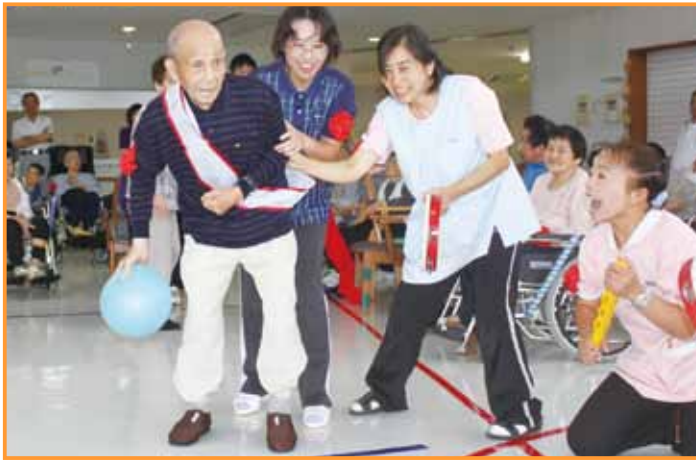
↑「ボトル倒し競争」の競技で、自分の杖を投げ捨てて参加した入所者