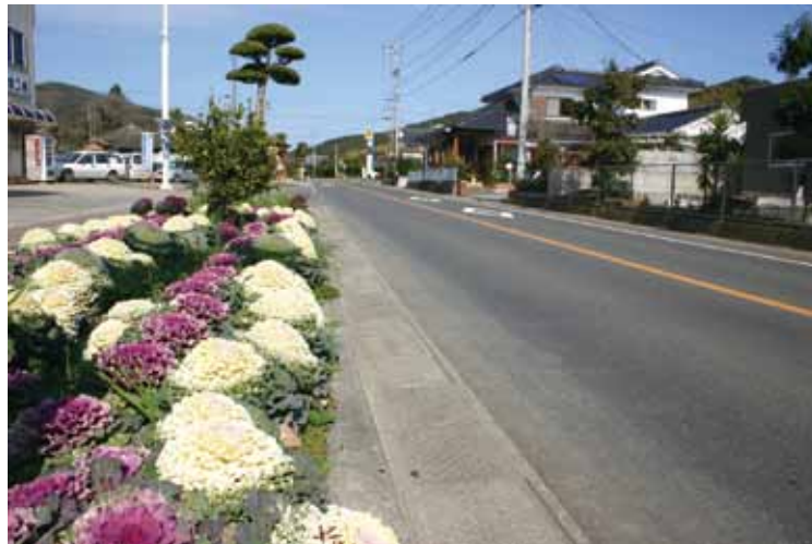
道路脇で満開に咲き誇る葉牡丹（平成23年2月川床地区で撮影）→

beautiful island and a wonderful island. * *