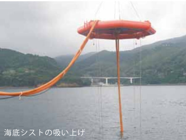
海底シストの吸い上げ