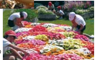
全児童での花づくり→