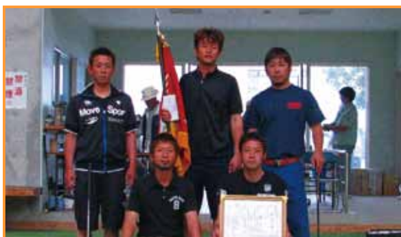
Aクラスで優勝した福ノ浦A ↑

Aランク [優勝] 福ノ浦A [2位] 伊唐 [3位] 脇崎 Bランク [優勝] 本町 [2位] 山寺B [3位] 山寺A Cランク [優勝] 矢堂C [2位] 葛輪B [3位] 西A