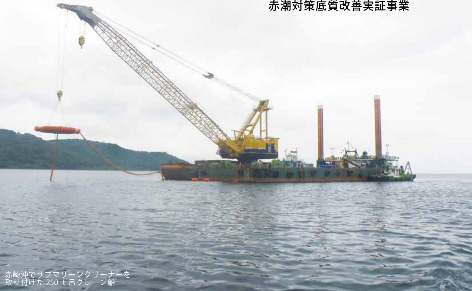
赤崎沖でサブマリンクリーナーを取り付けた 250 t 吊クレーン船