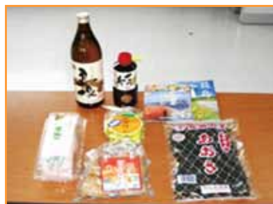
←賞品A賞の長島町特産品（3000円相当）