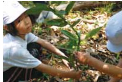
←「ひょうたん島」でマイツリーを観察