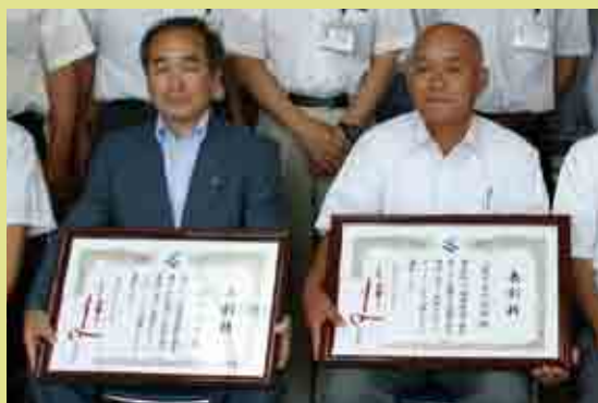
景観個人・団体が受賞されました

毎月第3日曜日を美化作業の日と定め、県道沿い約500mに花壇を設置し、年間を通して花の植栽、管理を行っております。また、町道の管理も定期的に行い道路愛護に貢献しています。