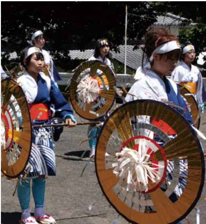
↑唐隈芸能保存会（かさ踊り）