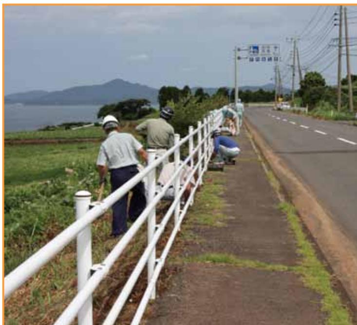
↑道路脇にケイトウの苗を植える会員

まず、午前8時30分に町体育館駐車場で出発式を行ったあと、花植えと空き缶拾いの2班に別れての作業となりました。当日は、真夏の太陽がふりそそぐ猛暑となりましたが、空き缶拾いは町内一周の県道と国道を、花植えは福ノ浦と川内の県道脇や唐隈と蔵之元の国道脇に、ケイトウの苗を1株ずつ丁寧に植えていきました。