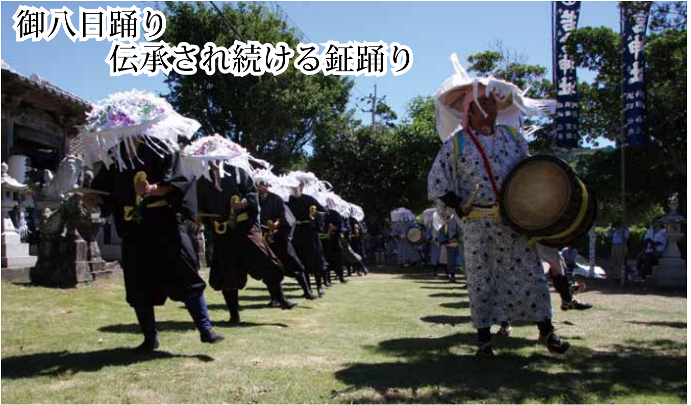
↑川床 4 公連鉦踊り保存会