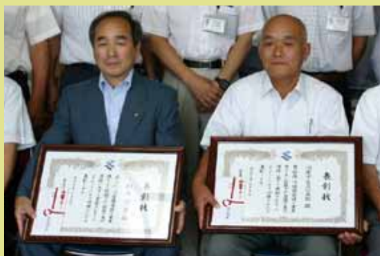
景観個人・団体が受賞されました

毎月第3日曜日を美化作業の日と定め、県道沿い約500mに花壇を設置し、年間を通して花の植栽、管理を行っております。また、町道の管理も定期的に行い道路愛護に貢献しています。