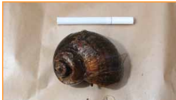
↓タバコと同じぐらいの長さ