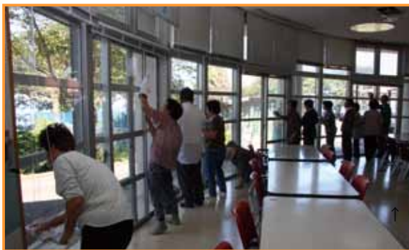
↑きれいになった大きな窓

この日は残暑が残る中、園庭の草払いや草むしり、窓の拭き掃除など毎日の生活では手の届きにくい場所を清掃され、施設側や入所者から大変喜ばれていました。