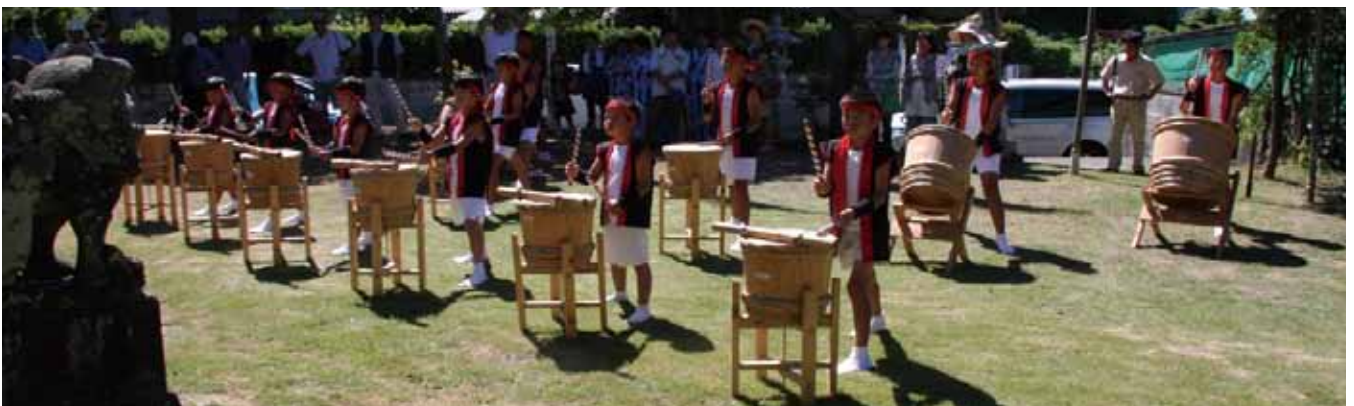
↑汐見小学校（樽太鼓）

今年も、昨年引き続き赤潮の被害がありました。その悪夢を吹き飛ばすかのような踊り子たちの舞には圧倒されました。