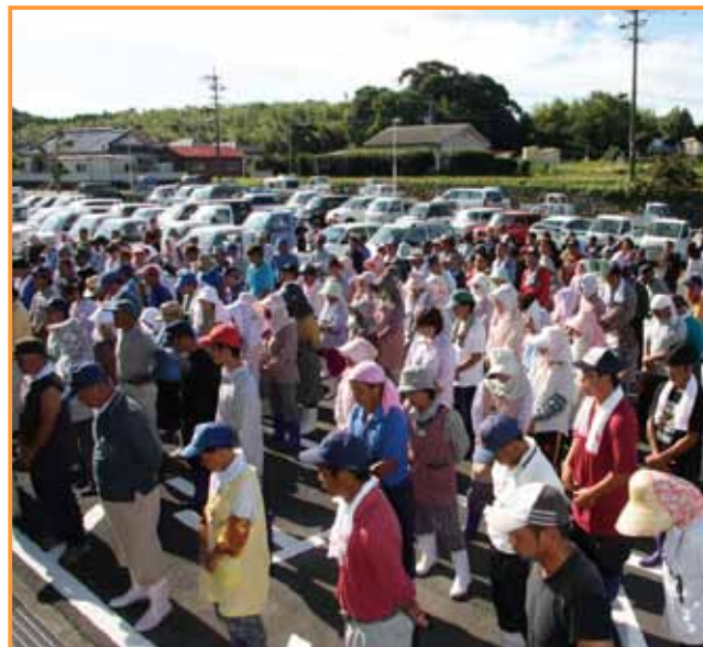
↑大勢の漁業関係者が集まりました

出発式修了後は各班に割り当てられた草払いや海岸清掃、死魚の埋め立て管理の仕事に当たりました。