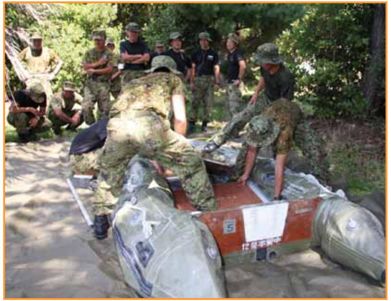
↓タイムを計りボートを組み立てる

1日目は、体力増強のため町内の主要道20kmの持続走と、体育館を使い銃剣道の練習、そして小浜海水浴場では義装泳や水難救助の訓練をしました。2日目は、災害救助や有事の際使用するボート組立て訓練を行い、規律と手際の良さは感動物でした。