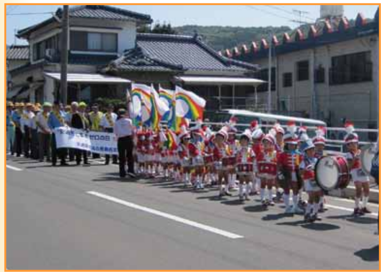
↑指江幼稚園の鼓笛隊にあわせて行進