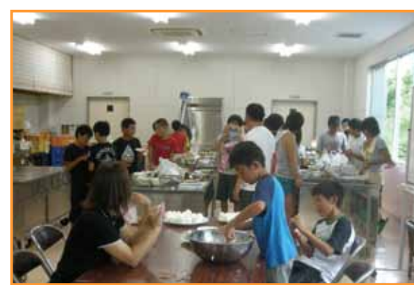
←料理づくりに挑戦する子どもたち