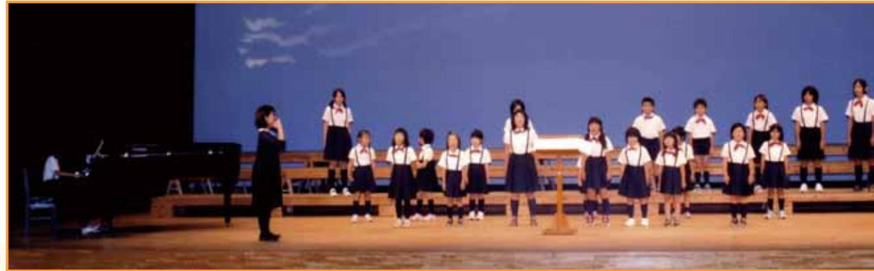
↓川床小学校合唱部が友情出演し、「われは海の子」などを熱唱