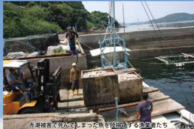
赤潮被害で死んでしまった魚を陸揚げする漁業者たち