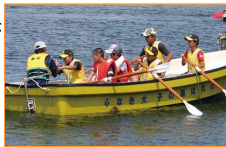
↑カッターに乗り込み、地元のを満喫

2日目は、子どもたちの安全教育と水辺の安全教育の研修を行いました。料理は子どもたちがグループごとにメニューを決め、電卓を片手に予算内で食材や調味料などの買出しを行い、すべての日程を子どもたちの協力で終わりました。