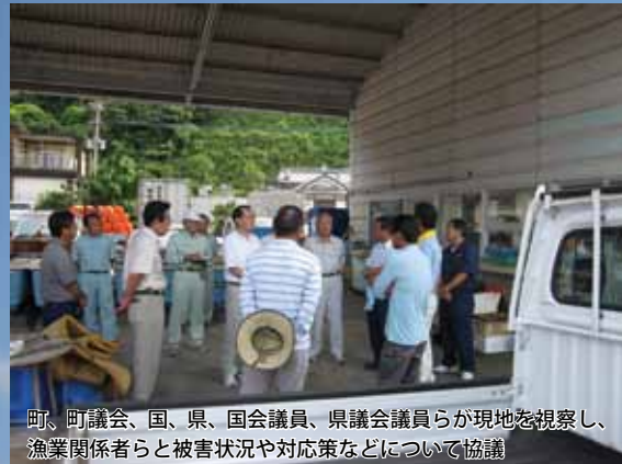
町、町議会、国、県、国会議員、県議会議員らが現地を視察し、漁業関係者らと被害状況や対応策などについて協議