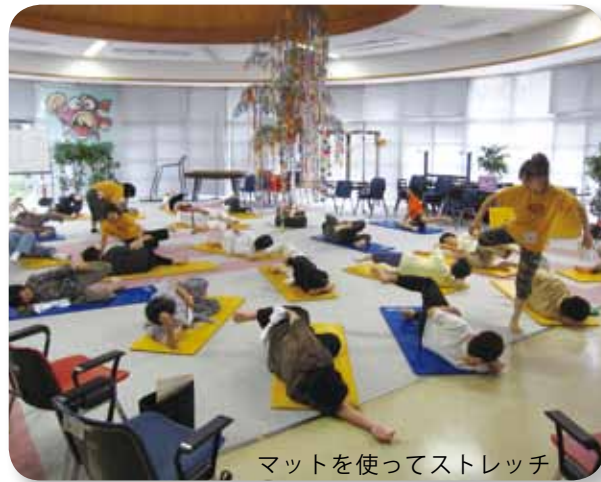
マットを使ってストレッチ

本町の高齢者には、足腰や膝の痛みを抱えている人が多くみられます。これは、長年にわたり農林漁業等に従事し、重い荷物を背負うなどしてきたことが原因の一つと考えられます。また、暮らしが便