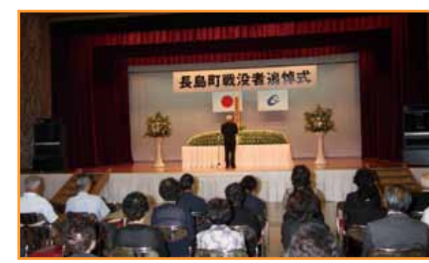
↑平和を願い開かれた追悼式

最後に参列者全員が祭壇に献花して、戦没者の冥福を祈り、恒久平和への願いを新たにしました。