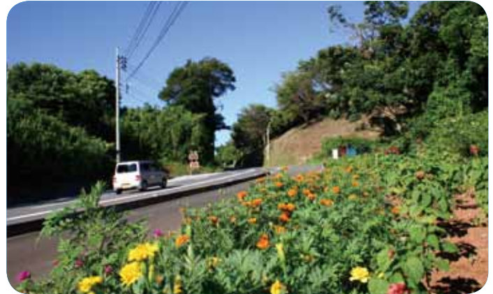
beautiful island and a wonderful island. * *