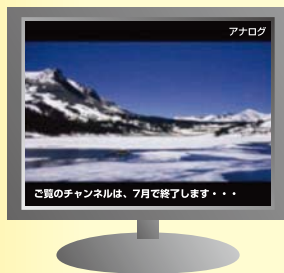
実際の表示内容、表示形式、時期等は今後検討される予定