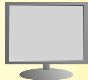
アナログ放送は映りません

BSアナログ放送も2011年7月24日までに終了し、デジタル放送に切り替わります。