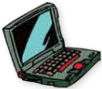
インターネットで申請