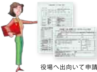
役場へ出向いて申請