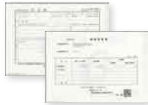
住民票・各種証明書