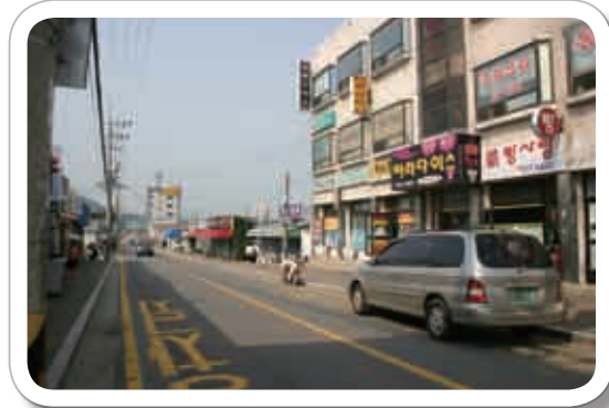
↑吉祥面の役場前通り。この町のメインストリートです。