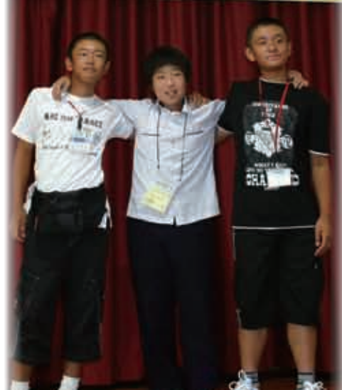
歓迎式での出会い（中央が韓国の学生）

験ができるでしょう」とあいさつ。団員は2台のバスで鹿児島空港へ向けて出発しました。