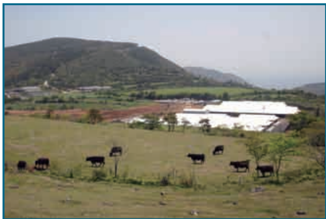
↑ 毎床にある繁殖実験センターの全景

鹿児島いずみ農協が建設を進めていた肉用牛繁殖実験センターの規模拡大工事が終了し、4月24日、落成式がありました。この施設は、これまで母牛200頭規模の運営を行ってきましたが、子牛育成舎等の増設のほか、発情発見装置などの新技術を取り入れ、今後は繁殖農家の生産基盤強化に役立てられます。