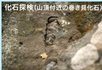
化石探検(山頂付近の巻き貝化石)