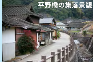
平野橋の集落景観