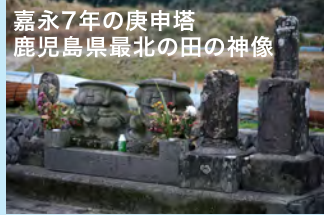
嘉永7年の庚申塔 鹿児島県最北の田の神像