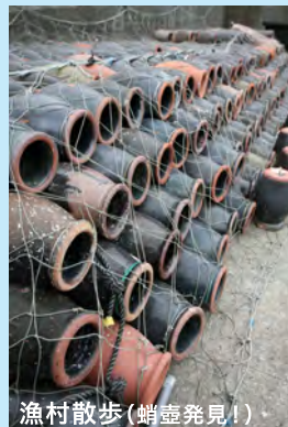
漁村散歩(蛸壺発見!)