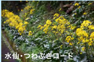
水仙・つわぶぎロード