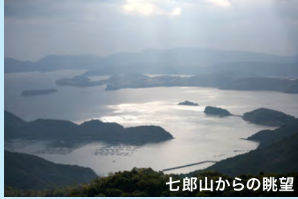
七郎山からの眺望