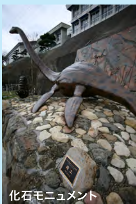
化石モニュメント