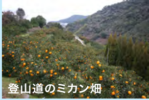
登山道のミカン畑